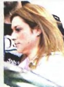
Η εισαγγελέας εγκλημάτων διαφθοράς Πόπη Παπανδρέου.

Καλά πληροφορημένες πηγές, μάλιστα, αναφέρουν πως η διαβεβαίωση αυτή έγινε και προσωπικά σε εκείνον, όταν ο ίδιος επικοινωνήσε με τις δικαστικές αρχές ζητώντας διεκρινίσεις για το πώς ενεπλάκη το όνομά του στην υπόθεση.