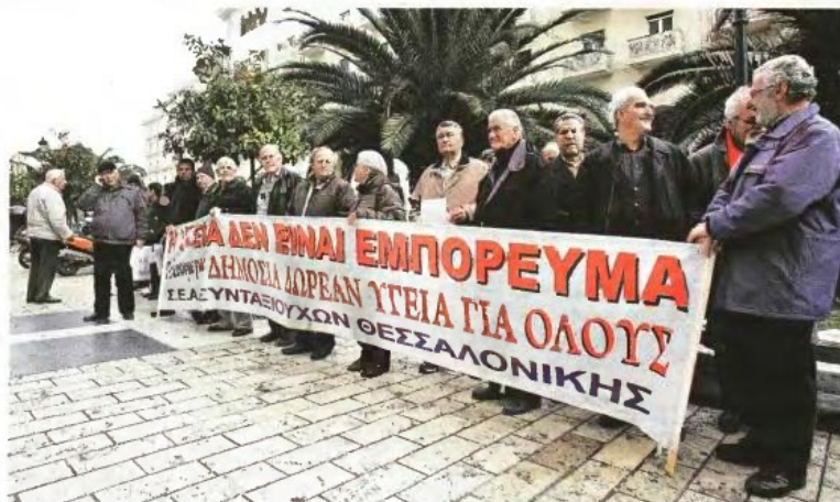
Την αντίδρασή τους στα χαράτσια που επιβάλλονται, δυσκολεύοντας την πρόσβαση των ασθενών σε φάρμακα και νοσοκομειακή περίθαλψη, εξέφρασαν κτες συνταξιούχοι στη Θεσσαλονίκη

«Ο κόσμος γκρινιάζει για την επιβολή του ενός ευρώ και αυτό είναι λογικό. Λίγοι είναι οι ασθενείς που εξαιρούνται και δε θα το πληρώνουν. Αυτό αναγνωρίζεται αυτομάτως από το σύστημα, όταν εκτελείται η συνταγή του ασφαλισμένου στο φαρμακείο. Το κόστος συμμετοχής στα φάρμακα αυξάνεται όμως με το συγκεκριμένο μέτρο, αφού οι ασφαλισμένοι πληρώνουν ένα ευρώ για μια συνταγή, δυο ευρώ για δυο συνταγές κ.ο.κ. Δε φαίνεται δυστυχώς να υπάρχει διάθεση από την κυβέρνηση να το αλλάξουν. Μακάρι να έβρισκαν ισοδύναμο μέτρο, όπως συνέβη