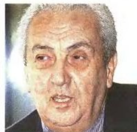
Αναστασία Σακελλαρίου, επικεφαλής του Ταμείου Χρηματοοικονομικής Σταθερότητας, Κυριάκος Γριβέας, Αγγελος Φιλιππίδης και Δημήτρης Κοτομνής από τα πλέον «βαριά» ονόματα που εμπλέκονται στο θέμα των «γκρίζων» δανείων του Τ.Τ.