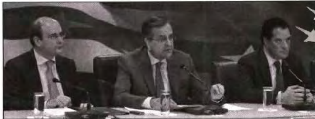
Ο υπουργός Ανάπτυξης κ. Κωστής Χατζηδάκης, ο πρωθυπουργός κ. Αντώνης Σαμαράς και ο υπουργός Υγείας κ. Άδωνης Γεωργιάδης

βεβαίως με τη βοήθεια της πληροφορικής, προχωρούμε σε μια σειρά από μεταρρυθμίσεις που αλλάζουν την εικόνα σε σχέση με τις αδειοδοτήσεις. Η νομοθεσία που δουλέψαμε εισάγει τέσσερις βασικές τομές: Πρώτον, υπεύθυνη δήλωση. Στις περισσότερες περιπτώσεις θα αρκεί μια υπεύθυνη δήλωση για να ξεκινήσει κάποιος την επιχείρησή του, αναλαμβάνοντας και την ευθύνη. Σε λίγες περιπτώσεις, για λόγους δημόσιου συμφέροντος, παραδείγματος χάριν προστασία, του περιβάλλοντος, θα χρειάζεται και ειδική έγκριση λειτουργίας από τις αρχές. Δεύτερον, οι έλεγχοι μεταφέρονται όχι στην παροχή της άδειας, αλλά στη λειτουργία της επιχείρησης. Στο εξής δεν θα εξετάζουμε χαρτιά κατά την ίδρυση της επιχείρησης, αλλά θα εξετάζουμε τις εγκαταστάσεις οι οποίες δουλεύουν, τις