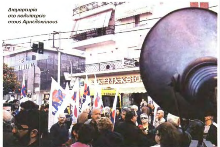
Διαμαρτυρία στο πολυιατρείο στους Αμπελοκλήπους

Οι γιατροί παραμένουν στην είσοδο του κτηρίου όπου δουλεύουν ολόκληρες δεκαετίες. Εξηγούν, σε εκπροσώπους φορέων (φαρμακοποιών, συλλόγων γονέων, λαϊκών αγορών κ.ά.) ότι «παροδίδουν στην Περιφέρεια την περιουσία του ΙΚΑ και βγάζουν όλο το προσωπικό σε διαθεσιμότητα».