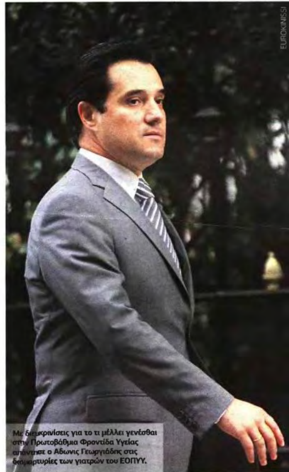
Με διακρίσεις για το τι μέλλει γενέσθαι στην Πρωτοβάθμια Φροντίδα Υγείας απάντησε ο Αδωνις Γεωργιάδης στις δημοκρατίες των γιατρών του ΕΟΠΥΥ.

Στο μεταξύ, χτες το βράδυ, δημοσιεύθηκε στην Εφημερίδα της Κυβερνήσεως ο νόμος 4238 (στο ΦΕΚ 38Α/17-2-2014 για το ΠΕΔΥ), βάζοντας και τυπικά σε διαθεσιμότητα γιατρούς και λοιπούς εργαζόμενους στα πολυιατρεία. ■