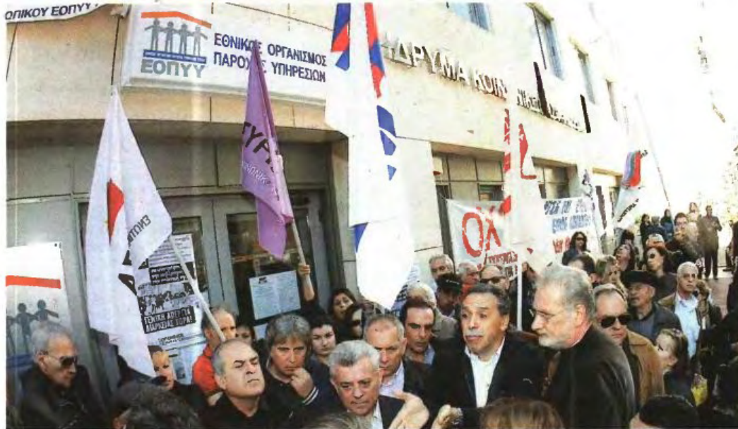
▲ ΓΙΑΤΡΟΙ ΚΑΙ ΠΟΛΙΤΕΣ με επικεφαλής τον δήμαρχο Καισαριανής εμπόδισαν χθες τους υπαλλήλους να σφραγίσουν το κτίριο του ΕΟΠΥΥ. Ανάλογες συγκεντρώσεις διαμαρτυρίας έγιναν σε πολλές περιοχές της χώρας