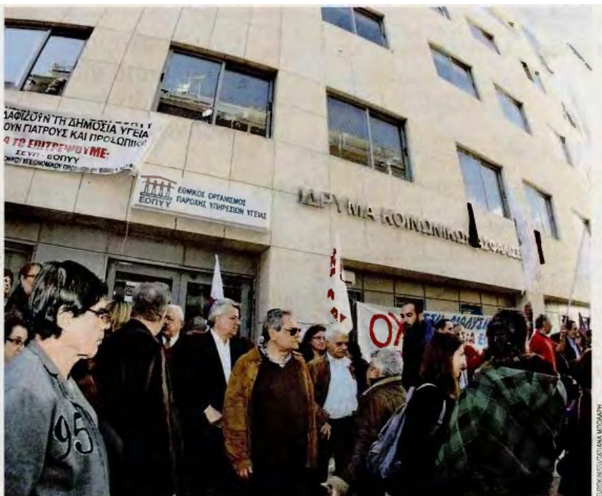
Συγκέντρωση διαμαρτυρίας για το κλείσιμο των πολυιατρείων του ΕΟΠΥΥ πραγματοποιήθηκε και στο Παγκράτι.

Με απόφαση του υπουργείου Υγείας, ο ΕΟΠΥΥ προχώρησε στην απελευθέρωση του ορίου συνταγογράφησης των ιατρών των Κέντρων Υγείας, περιφερειακών ιατρείων και νοσοκομείων,