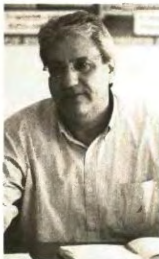
Δ. Βαρνάβας: Είναι ασύλληπτο στον κοινό νοου το θέαμα που δίνουν τα ράντζα στο Αττικό Νοσοκομείο

3. Είναι ασύλληπτο στον κοινό νοου το θέαμα που δίνουν