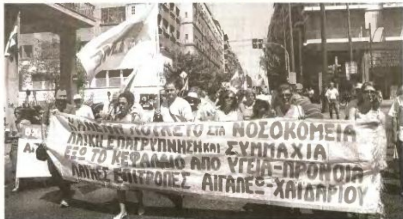
Από παλιότερη κινητοποίηση με αιχμή τα ζητήματα της Υγείας

Παρεμβαίνοντας χτες στην Επιτροπή της Βουλής, ο εισηγητής του ΚΚΕ Γ. Λαμπρούλης ανέφερε, μεταξύ άλλων: «Το συγκεκριμένο νομοσχέδιο και όλα τα μέτρα που παίρ-