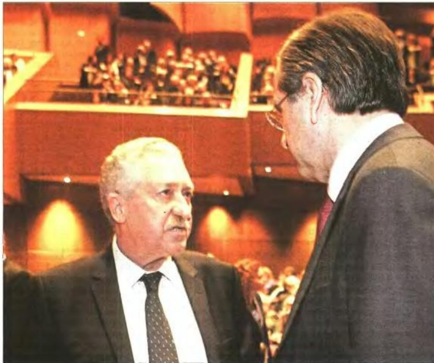
» Η προσωπική της υποψηφιότητας του Φ. Κουβέλη για την Προεδρία της Δημοκρατίας, μετά από πρόταση του Αντ. Σαμαρά, εξακολουθεί να αποτελεί σημείο αναφοράς συγκλίσεων, αλλά και διαφωνιών, στο εσωτερικό των κομμάτων

Μ. Βορίδης, χωρίς να αναφερθεί σε συγκεκριμένα ονόματα, υπογράμμισε ότι θα ήθελε ένα πρόσωπο από τον χώρο της Κεντροδεξιάς, προσθέτοντας, ωστόσο ότι «επειδή αυτό το πρόσωπο πρέπει να εκφράζει ευρύτερες συναίνεσεις, πρέπει να έχει χαρακτηριστικά διείσδυσης και ευρύτερης αποδοχής».