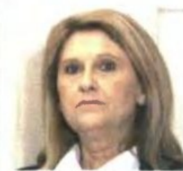
Σ. Βούλτεψη: Υπάρχουν άλλες προτεραιότητες.