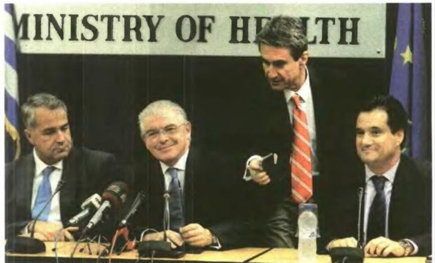
▲ Ο ΥΠΟΥΡΓΟΣ ΥΓΕΙΑΣ Μ. Βορίδης με τους πρώην υπουργούς Α. Λυκουρέντζο, Α. Λοβέρδο και Αδ. Γεωργιάδη, κα- τά την παρουσίαση του πορίσματος των ελέγχων για τα νοσήλια που κατέβαλε ο ΕΟΠΥΥ σε ιδιωτικές κλινικές

Καταγράφηκαν παράλληλες νο- σηλείες του ίδιου ασφαλισμένου σε διαφορετικά νοσοκομεία την ίδια χρονική περίοδο! Υπήρξαν, επίσης, χρεώσεις για διαγνωστικές εξετάσεις