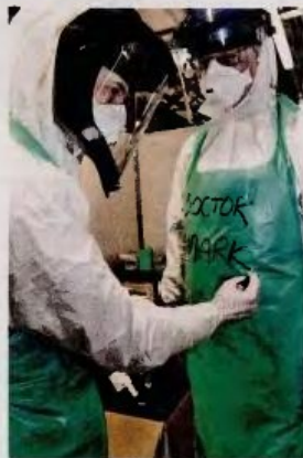
Άσκηση ετοιμότητας για τον ιό του Εμπολα πραγματοποιήσε χθες ο βρετανικός στρατός στο Γιορκ της Βόρειας Αγγλίας.

– Είναι ιός ο Εμπολα; – Παρά την ιδιαίτερα μεγάλη