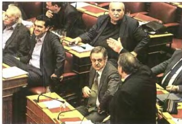
» Ανάλογες στιγμές αντιπαράθεσης αναμένεται να υπάρξουν πολλές κατά τη διάρκεια της τριήμερης συζήτησης στη Βουλή που ξεκινά σήμερα

Η απόφαση του Αντ. Σαμαρά να ορίσει ως αντικαταστάτη του τον Μ. Βορίδη στην έναρξη της συζήτησης, καθώς ο ίδιος θα βρίσκεται στις Βρυξέλλες για τη Σύνοδο Κορυφής της Ε.Ε., προιδέαζει για αντιπαράθεση υψηλών τόνων, καθώς ο υπουργός Υγείας θεωρείται στέλεχος που μπορεί να υποπειρώσει τη δεξιά πλευρά του κόμματος, αλλά και πολλούς από τους ανεξάρτητους βουλευτές, ενώ ασκεί σκληρή κριτική στον ΣΥΡΙΖΑ και έχει ε-