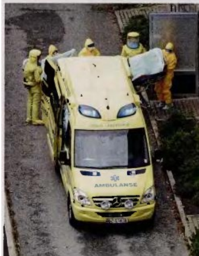
Ο πρώτος Νορβηγός ασθενής με Εμπολα εισήλθε χθες για νοσηλεία σε πανεπιστημιακό νοσοκομείο στο Οσλο.

Σε χώρο του νοσοκομείου «Αμαλία Φλέμγκ» – Έχει ορισθεί το εργαστήριο «αναφοράς» για τον ιό – Σε ετοιμότητα το ΕΚΑΒ.