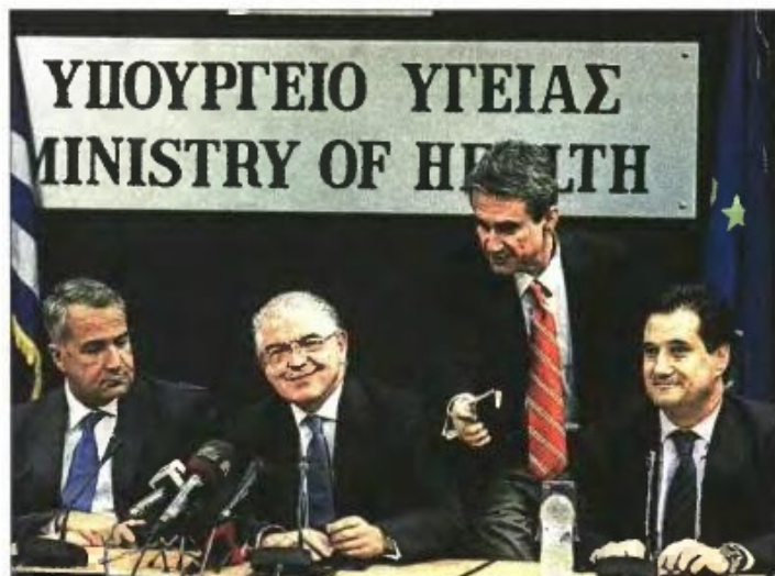
» Τρεις πρώην υπουργοί Υγείας, οι κ. Λοβέρδος, Λυκουρέντζος και Βορίδης, μαζεύτηκαν χθες για να παρουσιάσουν το πόρισμα ελέγχου

Το πόρισμα ελέγχου παρουσίασε χθες ο υπουργός Υγείας Μάκης Βορίδης -παρουσία των προκατόχων του κ. Ανδρέα Λοβέρδου, Ανδρέα Λυκουρέντζου και Άδωνι Γεωργιάδη- ο οποίος ανακοίνωσε την επέκταση των ελέγχων και στα έτη 2012, 2014 καθώς και στα δημόσια νοσοκομεία. Ξεκαθάρισε