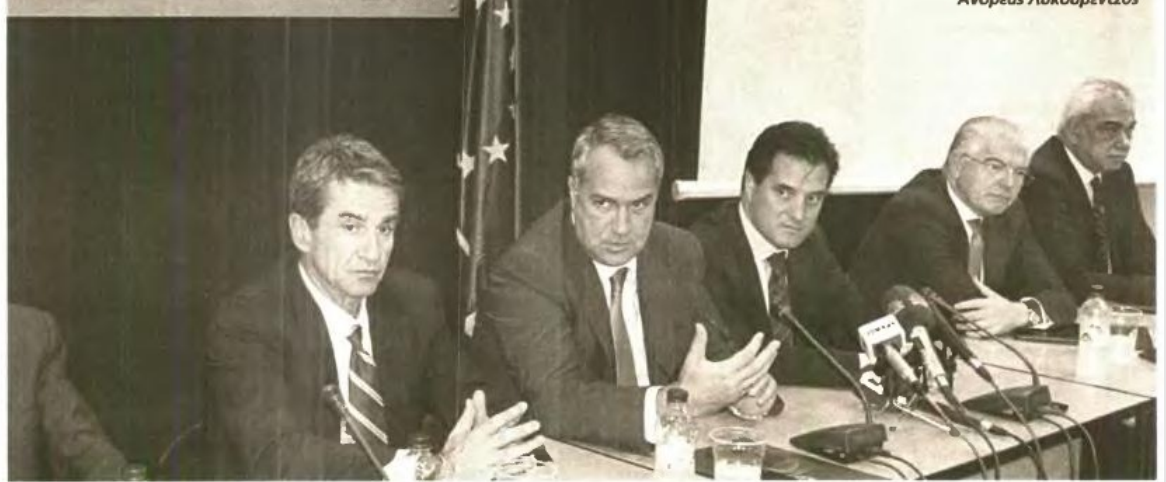
Όλος ο θίασος επί σκηνής στο υπουργείο υγείας: τον νυν υπουργό Μάκη Βορίδη πηλασιώνουν οι πρώην Ανδρέας Λοβέρδος, Αδωνίς Γεωργιάδης, Ανδρέας Λυκουρέντζος