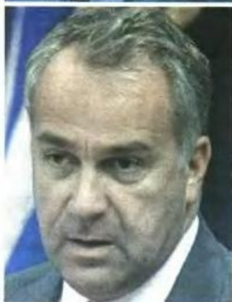
Αριστερά: Ο υπ. υγείας Μάκης Βορίδης

βεβλημένων παρόχων υγείας του οργανισμού ξεκίνησαν το 2010 επί υπουργίας Ανδρέα Λοβέρδου, συνεχίστηκε επί υπουργίας Ανδρέα Λυκουρέντζου και Αδωνη Γεωργιάδη και ολοκληρώθηκε επί υπουργίας Μάκη Βορίδη. Γι' αυτό ο κ. Βορίδης κάλεσε χθες τους τρεις προκατόχους του προκειμένου να τους ευχαριστήσει για τη συνεργασία.