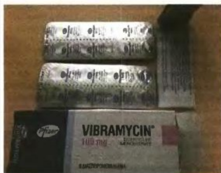
▲ ΤΟ ΑΝΤΙΒΙΟΤΙΚΟ «VIBRAMYCIN» το οποίο διατίθεται στο eBay με το σήμα του ΕΟΦ και σβησμένα τα ελληνικά γράμματα