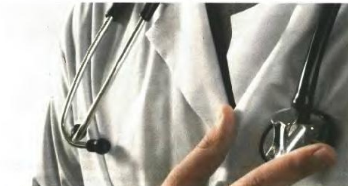
Αυτό που προκαλεί εντύπωση είναι πως στους λογαριασμούς τεσσάρων εκ των κατηγορουμένων γιατρών βρέθηκαν καταθέσεις χρηματικών ποσών οι οποίες διαπιστώθηκε από το ΣΔΟΕ πως έγιναν από φαρμακευτικές εταιρείες.

Το 2008 η εισαγγελία άσκησε ποινικές δίωξεις σε βάρος μελών επιτροπών των