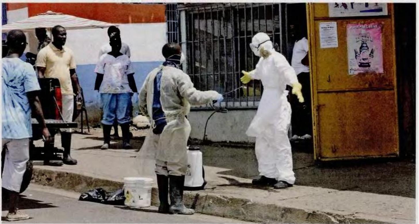
Απολύμανση στη Μονρόβια. Η επιδημία του Εμπολα έχει περισσότερα από 4.500 θύματα στη Λιβερία, τη Σιέρα Λεόνε και τη Γουινέα.