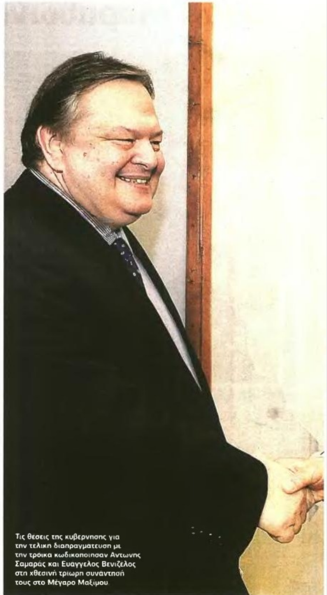
Τις θέσεις της κυβέρνησης για την τελική διαπραγμάτευση με την τρέχια κωδικοποίηση Αντώνης Σαμαράς και Ευάγγελος Βενιζέλος στη χθεσινή τριώρη συνάντησή τους στο Μέγαρο Μαξίμου

Υπενθυμίζεται ότι ο κ. Σαμαράς θα επισκεφθεί την Κύπρο στις 7 Νοεμβρίου και αμέσως μετά θα μεταβεί στο Κάιρο, για την πρώτη τριμερή συνάντηση Κορυφής, Ελλάδας, Κύπρου, Αιγύπτου. ■