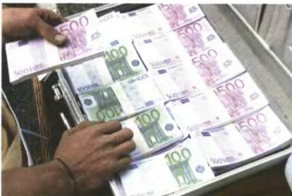
▲ Η ΑΠΟΣΤΟΛΗ εμβασμάτων στο εξωτερικό αποτελεί νόμιμη ενέργεια και ο έλεγχος αφορά αποκλειστικά το εάν τα ποσά που έχουν αποσταλεί δικαιολογούνται από νόμιμα εισοδήματα