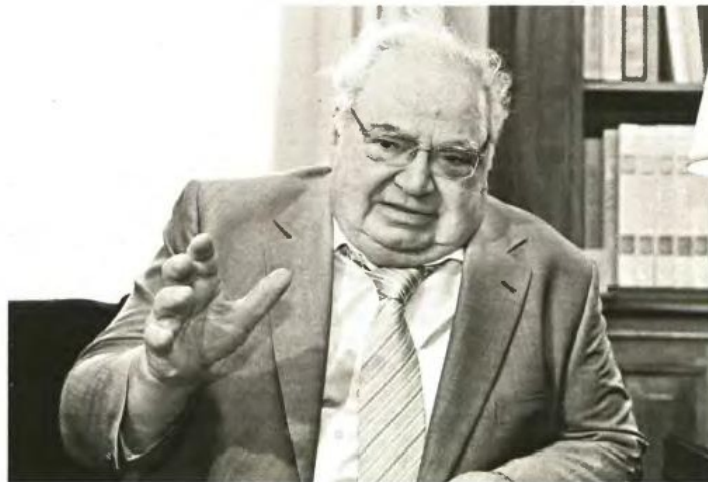
«Στην προσπάθειά μου να παραπέμνω κάποιους επωνύμους βρίσκω ένα τείχος. Βγαίνουν απαλλακτικά βουλεύματα για τα οποία δεν μπορώ να κάνω τίποτα», ανέφερε στις 17 Σεπτεμβρίου 2014 ο Λεάνδρος Ρακιντζής σε εισηγήσή της Βουλής

2. Το 2010 διενεργήθηκε έλεγχος στον Οργανισμό Κατά των Ναρκωτικών (ΟΚΑΝΑ), όπου διαπιστώ-