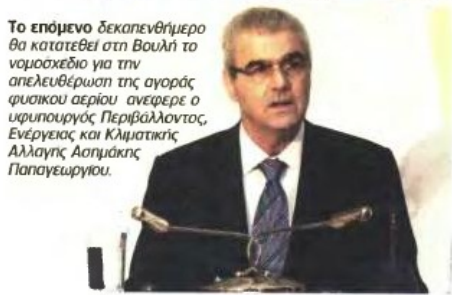
Το επόμενο δεκαενημέριο θα κατατεθεί στη Βουλή το νομοσχέδιο για την απελευθέρωση της αγοράς φυσικού αερίου, ανέφερε ο υφυπουργός Περιβάλλοντος, Ενέργειας και Κλιματικής Παλαγολογίου .

Περιβάλλοντος, Ενέργειας και Κλιματικής Αλλαγής Ασημάκης Παπαγεωργίου. Ο υφυπουργός ΠΕ-ΚΑ αναφέρθηκε στα μέτρα που ελήφθησαν τα τελευταία χρόνια και με τα οποία επιλύθηκαν, όπως είπε, οι περισσότερες από τις προβλήματα στην ενεργειακή αγορά, ενώ υπογράμμισε ότι η Ελλάδα μετατρέπεται σε ενεργειακό κόμβο στην ευρύτερη περιοχή.