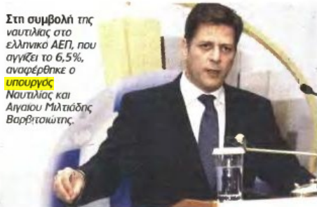
Στη συμβολή της ναυτιλίας στο ελληνικό ΑΕΠ, που αγγίζει το 6,5%, αναφέρθηκε ο υπουργός Ναυτιλίας και Αιγαίου Μιλτιάδης Βαρβιτσιώτης .

Το επόμενο δεκαενημέριο θα κατατεθεί στη Βουλή το νομοσχέδιο για την απελευθέρωση της αγοράς φυσικού αερίου με το οποίο καταργούνται τα τοπικά μονοπώλια, ανέφερε ο υφυπουργός