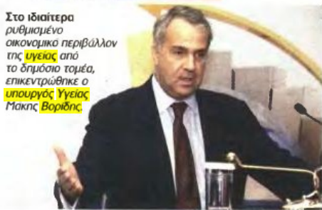
Στο ιδιαίτερα ρυθμισμένο οικονομικό περιβάλλον της Υγιούς από το δημόσιο τομέα, επικεντρώθηκε ο υπουργός Υγείας Μάκης Βορίδης .