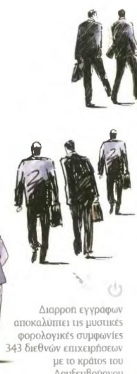
Διαρροη εγγράφων αποκαλύπτει τις μυστικές φορολογικές συμφωνίες 343 διεθνών επιχειρήσεων με το κράτος του Λουξεμβούργου

βούργο μπορεί να «απογυμνώσει» έσοδα από όποια χώρα και να προέρχονται» δήλωσε ο Stephen E. Shay, καθηγητής Διεθνούς Φορολογίας στη Νομική Σχολή του Χάρβαρντ και πρώην στέλεχος επί φορολογικών θεμάτων του υπουργείου Οικονομικών των ΗΠΑ. Το Μεγάλο Δουκάτο, είπε, «συνδυάζει τεράστια ευελιξία στη δημιουργία σχημάτων ελάφρυνσης φόρων, τα οποία μαζί με τις δεσμευτικές φορολογικές αποφάσεις του είναι μοναδικά. Είναι σαν μία μαγική νεραϊδοκάρα». Ανάμεσα στις επιχειρήσεις που αναζήτησαν, σύμφωνα με τα έγγραφα, φορολογικές συμφωνίες με το Λουξεμβούργο περιλαμβάνονται ονόματα όπως αυτά του Accenture, Abbott Laboratories, American International Group (AIG), Amazon, Blackstone, Deutsche Bank, Fed Ex, HJ