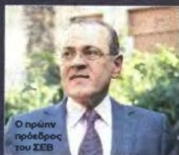
Ο πρώην πρόεδρος του ΣΕΒ

Πεδίο εκκαθάρισης λογαριασμών στο επιχειρηματικό (και βέβαια και στο πολιτικό) σκηνικό αποτελούν και οι διάφορες «λίστες». Υπάρχει καθορισμένη η λίστα Λαγκάρντ, η οποία βρίσκεται στο σταδίο της δικαστικής διερεύνησης και λιγότερο η περισσότερο εμφανής είναι οι πιέσεις προς τη μια ή την άλλη κατεύθυνση, καθώς είναι δεδομένη η εμπλοκή κορυφαίων ονομάτων του ελληνικού επιχειρείν. Με άγνωστο το τι θα συμβεί η οποία κατάληξη του θέματος.