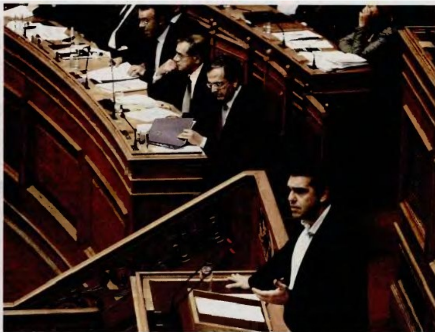
Ο κ. Αλ. Τσίπρας και οι συνεργάτες του θεωρούν ότι η ψηφοφορία επί του προϋπολογισμού δεν άλλαξε την εικόνα όσον αφορά τον συσχετισμό δυνάμεων για την προεδρική εκλογή.

Στην Κουμουνδούρου δεν κρύβουν την ανακούφισή τους για το αποτέλεσμα της ψηφοφορίας για τον προϋπολογισμό που, όπως λένε, δεν έδωσε στην κυβέρνηση «αέρα» ενίσχυσης και που δεν ευδοκίμησε η πρωτοβουλία βουλευτών, την προηγούμενη εβδομάδα, να συλλέξουν υπογραφές ζητώντας συμφωνία για εκλογή Προέδρου. «Το αποτέλεσμα της ψηφοφορίας και, τελικά, το ξεφούσκωμα από την προσπάθεια των ανεξάρτητων βουλευτών για να υπάρξει εκλογή και να δημιουργηθεί ένα κλίμα ευρύτερης συναίνεσης από την πα-