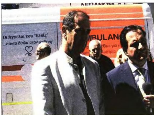
Ο υπουργός Υγείας Αδωνις Γεωργιάδης (δεξιά) με τον διοικητή του νοσοκομείου Έλπις Γιάνναρο στην τελετή παραλαβής του νέου σύγχρονου ασθενοφόρου

ΤΟ ΓΕΝΙΚΟ Νοσοκομείο Έλπις, στο οποίο έχουν τη δυνατότητα να νοσηλευτούν και να χειρουργηθούν δωρεάν οι ανασφάλιστοι πολίτες, παρέλαβε χθες ένα σύγχρονο ασθενοφόρο, δωρεά του αυστριακού Ερυθρού Σταυρού.