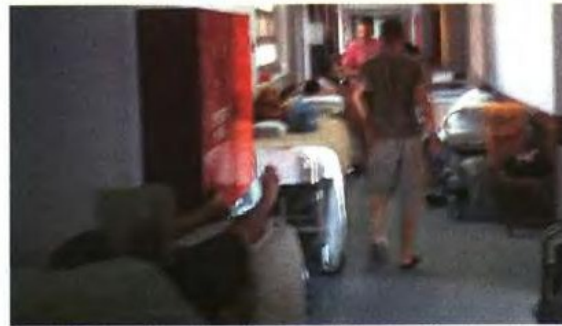
Αυτές είναι οι εικόνες που παρουσίαζε χθες η ψυχιατρική κλινική του Ευαγγελισμού