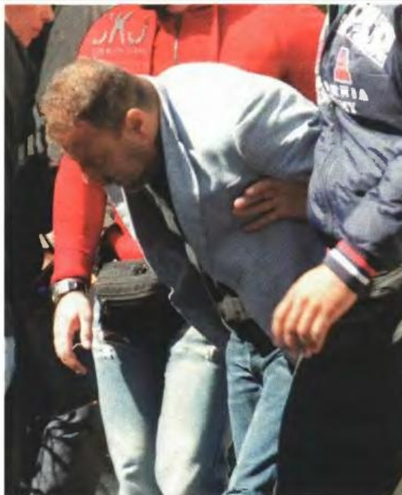
▲ Ο ΣΥΝΔΙΚΑΛΙΣΤΗΣ του «Σωτηρία» ενώ οδηγείται από αστυνομικούς στον ανακριτή