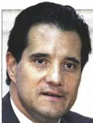
Ο υπουργός Υγείας Αδωνις Γεωργιάδης

της συρρίκνωσης δαπανών και της διαθεσιμότητας στο Δημόσιο. «Οι σοφοί - εμπειρογνώμονες, μέλη των επιτροπών που σχηματοποίησαν αυτές τις προτάσεις, είναι οι ίδιοι που σχεδίασαν και διοίκησαν από διάφορες θέσεις την Πρωτοβάθμια Φροντίδα Υγείας και μορφοποίησαν το τερατούργημα του ΕΟΠΥΥ. Οι μέχρι τώρα ενδείξεις συγκλίνουν στη συζήτηση ενός προαποφασισμένου σχεδίου μεγάλης περικοπής της δημόσιας υγείας και εκχώρησής της σε ιδιωτικές επιχειρήσεις, με επιβάρυνση των πολιτών» τόνισε σε ανακοίνωσή του ο Πανελλήνιος Ιατρικός Σύλλογος (ΠΙΣ). Στο ίδιο ύφος ήταν η τοποθέτηση της Πανελλήνιας Ομοσπονδίας Εργαζομένων