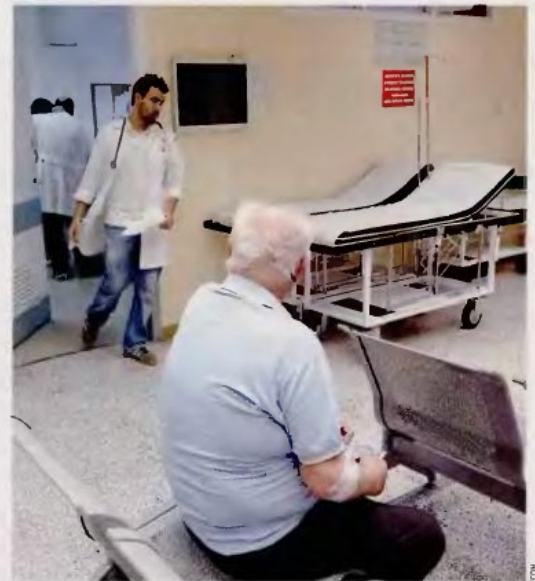
Hospitals and social security funds saw their non-state funding revenues fall by 1.3 billion euros, or 8.6 percent, within a year.

The ministry also announced yesterday the data on the level of state arrears to the private sector, which at end-August amounted to 6.5 billion euros. This constituted a slight improvement on end-July, when arrears added up to 6.7 billion euros. At the start of the year they amounted to 8.8 billion euros. Social security funds were responsible for more than half of the arrears at end-August (3.6 billion euros).