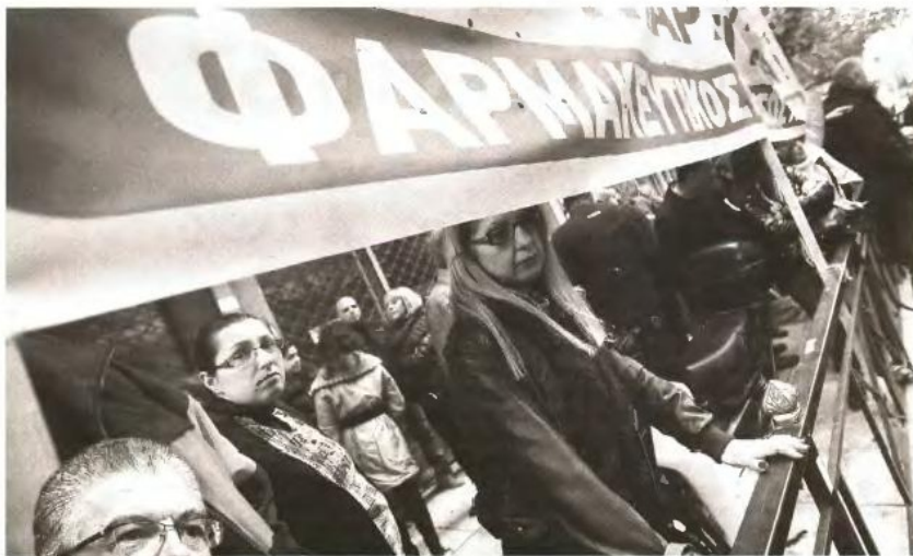
▲ Ο ΥΠΟΥΡΓΟΣ ΥΓΕΙΑΣ Αν. Λυκουρέντζος θεωρεί εκβιαστικές τις αντιδράσεις του κλάδου και απειλεί με απελευθέρωση ωραρίου

Οι φαρμακοποιοί θεωρούν ότι το υπουργείο Υγείας και η διοίκηση του ΕΟΠΥΥ είναι ασυνείηστος υποχρεώσεις που είχαν αναλάβει τον περασμένο μήνα για εξόφληση των χρεών του Οργανισμού, ενώ η κυβέρνηση κάνει λόγο για εκβίαση. Από τις σημερινές