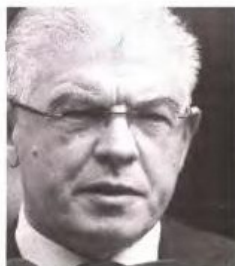
ΕΥΡΟΚΙΝΗΣΗ ΓΕΡΤΙΑ ΠΑΝΑΓΙΩΤΩΝΟΥ

■ Από την πλευρά τους οι γιατροί διεκδικούν από την πολιτεία να ενεργήσει προς την κατεύθυνση της ενδυνάμωσης του συστήματος Υγείας και των παροχών στους ασθενείς.