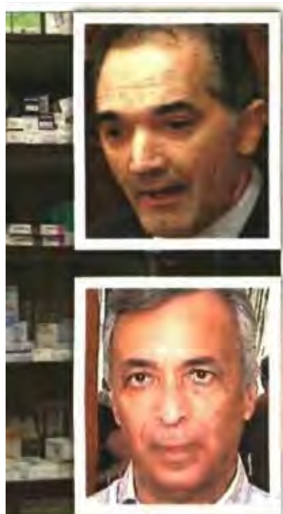
▲ Πάνω: Ο αναπληρωτής υπουργός Υγείας Μάριος Σαμιάς. Κάτω: Ο πρόεδρος του Φαρμακευτικού Συλλόγου Πειραιά Κώστας Κούβαρης, ο οποίος χαρακτήρισε «θετική εξέλιξη» την τήρηση των δεσμεύσεων του υπουργείου για έναρξη πληρωμών στους φαρμακοποιούς