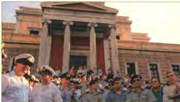
» Χάος χθες στην Αθήνα από τις απανωτές πορείες. Πάνω από 1.000 στρατιωτικοί εν ενεργεία και απόστρατοι συγκεντρώθηκαν στην Πλατεία Κολοκοτρώνη

Αναταραχή πριν ακόμη ανακοινωθούν τα μέτρα