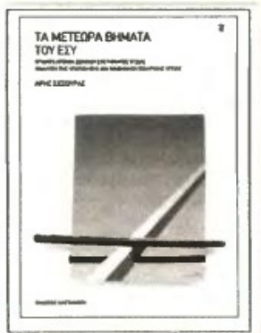
▲ «ΤΑ ΜΕΤΕΩΡΑ βήματα του ΕΣΥ» από τον Αρ. Σισσούρα

ΕΞΙ ΚΑΘΟΡΙΣΤΙΚΟΙ παράγοντες οδήγησαν σε διασάλευση την προσπάθεια για ολοκλήρωση της οργανωτικής και θεσμικής συγκρότησης του ΕΣΥ. Τους περιγράφει στο βιβλίο του «Τα μετέωρα βήματα του ΕΣΥ», ο ομότιμος καθηγητής του Πανεπιστημίου της Πάτρας και μέλος της επιτροπής σχεδιασμού του ΕΣΥ Αρης Σισσούρας.