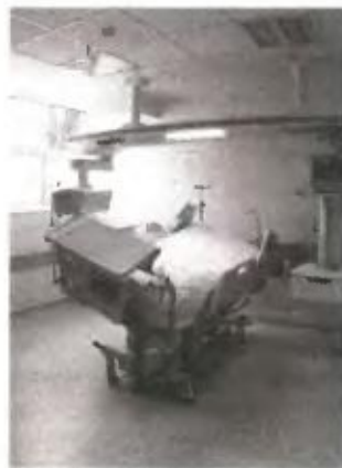
«Ένεση» στα μεγέθη τους αναμένουν οι κλινικές από την εξόφληση οφειλών του Εθνικού Οργανισμού Παροχής Υπηρεσιών Υγείας.

Ποιο είναι το χρονικό Αξίζει να σημειωθεί πως τα συ-