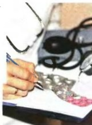
▲ ΤΗΝ ΕΝΤΟΚΗ είσπραξη των οφειλών του Δημοσίου θα διεκδικήσουν οι γιατροί, σύμφωνα με Οδηγία της ΕΕ

Ο πρόεδρος του Ιατρικού Συλλόγου Πειραιά (ΙΣΠ) ανακοίνωσε χθες ότι οι γιατροί θα κάνουν άμεση εφαρμογή της ιδρυσίας, προκειμένου να εισπράξουν εντόκως τα οφειλόμενα από τον ΕΟΠΥΥ.