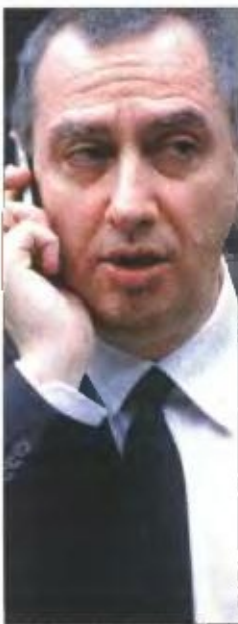
Ο βουλευτής της Ν.Δ. Γιάννης Μιχελάκης

ΝΑ ΜΗ ΓΙΝΟΥΝ οι καρκινοπαθείς «παράπλευρη απώλεια» της κρίσης ζητά με ερώτηση που κατέθεσε στον υπουργό Υγείας Ανδρέα Λυκουρέντζο ο βουλευτής της Ν.Δ. Γιάννης Μιχελάκης. Όπως επισημαίνει ο βουλευτής της Ν.Δ., λόγω της οικονομικής κρίσης υπάρχει ραγδαία αύξηση στη ζήτηση υπηρεσιών από ασθενείς στα δημόσια ογκολογικά νοσοκομεία κατά 30% και σε ορισμένα εξειδικευμένα τμήματά τους ακόμη και κατά 60%.