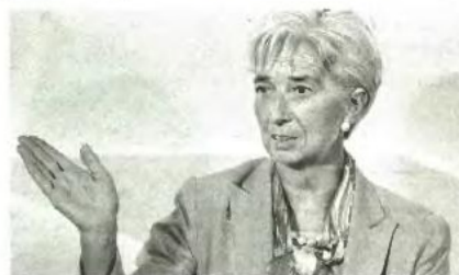
« Η ΕΠΙΚΕ-ΦΑΛΗΣ του ΔΝΤ Κρ. Λαγκάρντ θα συμμετάσχει στη συνεδρίαση του Eurogroup στη Λευκωσία

Μπορεί το βασικό θέμα της συνεδρίασης να είναι η δημοσιονομική κατάσταση της Ισπανίας, αλλά είναι βέβαιο ότι οι διαβουλεύσεις των υπουργών Οικονομικών της Ευρωζώνης, παρουσία της επικεφαλής του ΔΝΤ Κριστίν Λαγκάρντ, θα είναι καθοριστικές για το ελληνικό ζήτημα.