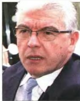
▲ Ο υπουργός Υγείας Ανδρέας Λυκουρέντζος. Αριστερά: Το πρωτοσέλιδο της «δημοκρατίας» στις 12 Σεπτεμβρίου 2012

«Εγώ τη λέξη τρόικα αποφεύγω να την αναφέρω. Την αναφέρουν συνήθως εκείνοι οι οποίοι της προσδίδουν έναν χαρακτή-