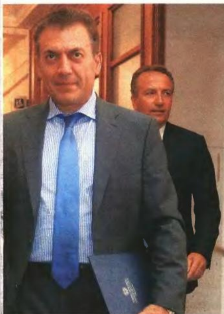
ΣΤΟ ΥΠΟΥΡΓΕΙΟ ΕΡΓΑΣΙΑΣ οι συνεργάτες του Γ. Βρούτση έχουν ήδη καταγράψει τι συνεπάγεται για κάθε κατηγορία ασφαλισμένων η αύξηση των ορίων ηλικίας

Σήμερα στο Δημόσιο και στα ασφαλιστικά ταμεία καταβάλλεται σύνταξη σε ηλικία 65 ετών, εφόσον έχουν συμπληρωθεί τουλάχιστον 15 έτη ασφάλισης