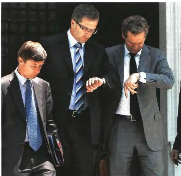
▲ Η ΤΡΟΪΚΑ φαίνεται πως δεν διαφωνεί στην «ανταλλαγή» των απολύσεων με την αύξηση των ορίων ηλικίας