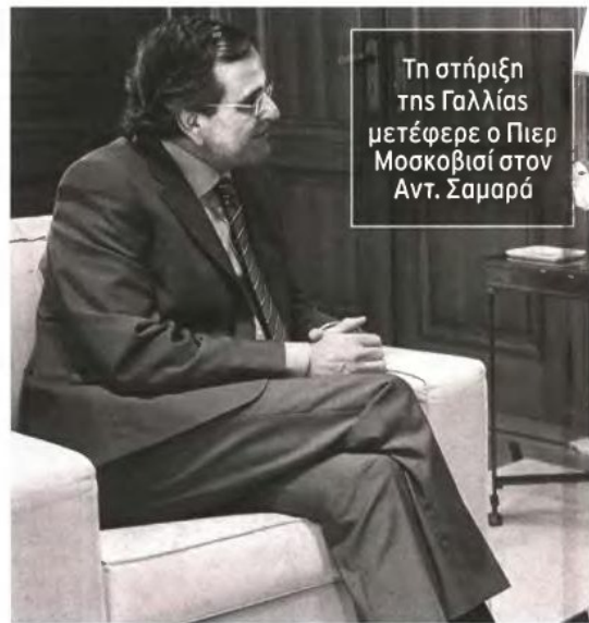
Τη στήριξη της Γαλλίας μετέφερε ο Πιερ Μοσκοβισί στον Αντ. Σαμαρά

Νωρίτερα χθες το μεσημέρι ο κ. Μοσκοβισί γευμάτισε με Γάλλους επικεφαλής επιχειρήσεων στην Ελλάδα και μετέφερε την επιθυμία τους να παραμείνουν στη χώρα μας και να ενδυναμώσουν την παρουσία τους με προγράμματα όπως από τον αποκρτικοποιήσεων. Για τις τριπλές που φεύγουν είπε ότι αυτό εντάσσεται στο πλαίσιο αναδιάρθρωσης του γαλλικού τραπεζικού κλάδου.