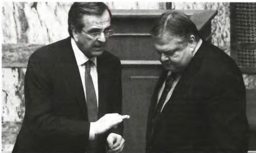
▲ Ο ΑΝΤΩΝΗΣ ΣΑΜΑΡΑΣ κατέστησε σαφές στους άλλους δύο πολιτικούς αρχηγούς ότι τα χρονικά περιθώρια έχουν στενέψει επικίνδυνα και πρέπει να υπάρξει άμεσα απόφαση για τα μέτρα

αύξηση των ορίων ηλικίας στα 66 ή στα 67 από το να προχωρήσει σε απολύσεις στο Δημόσιο. Επίσης, οι εκπρόσωποι των δανειστών μας υπαναχώρησαν -επί του παρόντος- από τη θέση τους για νέες αλλαγές στα εργασιακά (μείωση αποζημιώσεων, εξαήμερη εργασία κ.λπ.), γεγονός που διευκολύνει τον πρωθυπουργό και τους κ. Βενιζέλο και Κουβέλη στη λήψη των αποφάσεων τους.