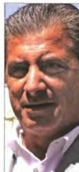
▲ Από αριστερά: Ο υπουργός Υγείας Ανδρέας Λυκουρέντζος, ο πρόεδρος της ΟΕΝΓΕ Δημήτρης Βαρνάβας και ο πρόεδρος του ΙΣΑ Γιώργος Πατούλης

Οι γιατροί υποστηρίζουν ότι για να κυκλοφορήσει ένα φάρμακο στην αγορά με ασφάλεια σημαίνει ότι υπάρχουν πιστοποιημένες μελέτες κλινικής αποτελεσματικότητας: «Για τα φάρμακα που θα εισαχθούν από το Μπανγκλαντές, την Ινδία και την Κίνα, ποιες μελέτες έχουν δημοσιοποιηθεί». Από την πλευρά του, πάντως, ο πρόεδρος της Ομοσπονδίας Ενώσεων Νοσοκομειακών Γιατρών Ελλάδας (ΟΕΝΓΕ) Δημήτρης Βαρνάβας τόνισε χθες ότι η ομοσπονδία είχε καταγγείλει δημοσίως το όργιο που συνέβαινε τα τελευταία χρόνια στην τιμολόγηση φαρμάκων υπό την υψηλή καθοδήγηση και κάλυψη της πολιτικής ηγεσίας του υπουργείου Υγείας.