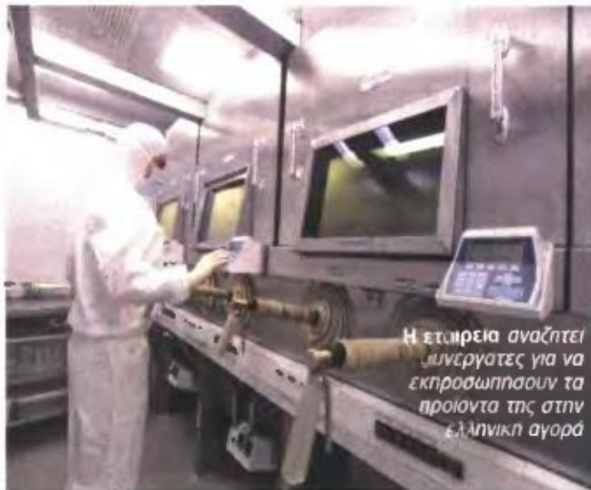
Η εταιρεία αναζητεί συνεργάτες για να εκπροσωπήσουν τα προϊόντα της στην ελληνική αγορά

[φάρμακα] Μετά την αποχώρηση από την Ελλάδα