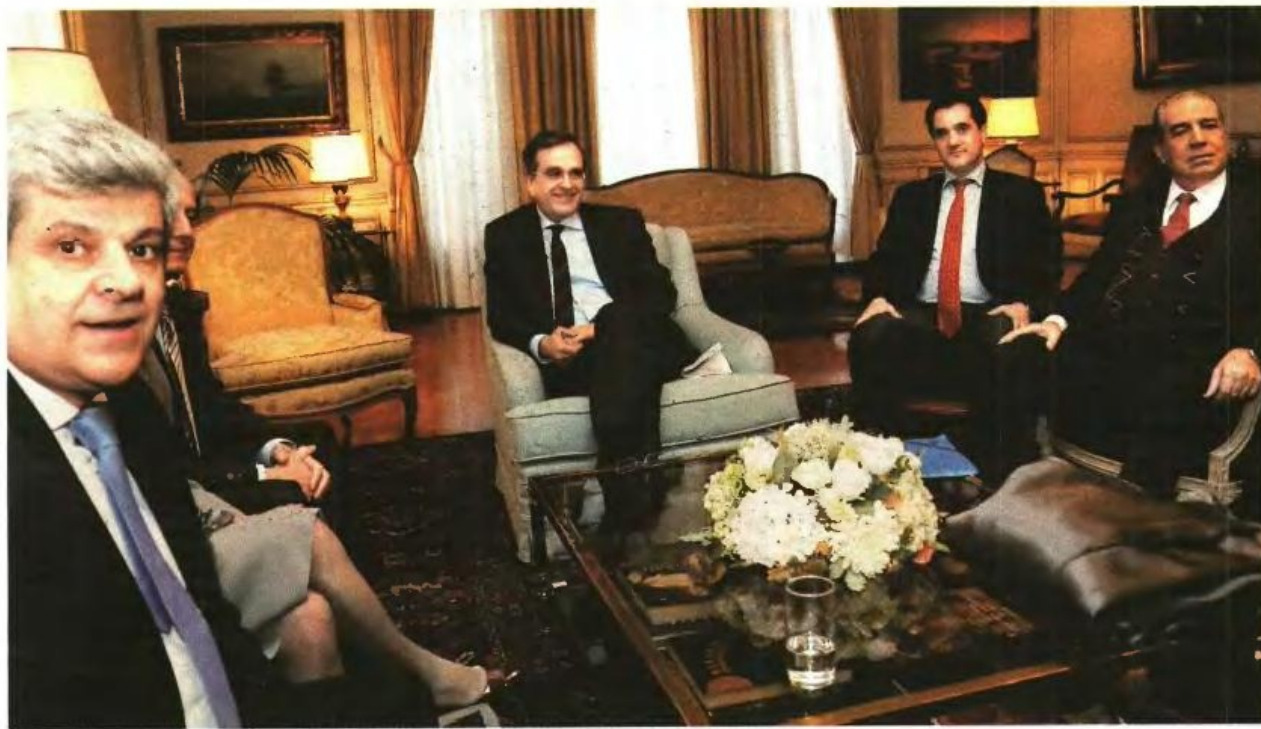
▲ Α. ΣΑΜΑΡΑΣ και Α. Γεωργιάδης συναντήθηκαν χθες στο Μέγαρο Μαξίμου με εκπροσώπους των γιατρών και συζητήσαν για τα προβλήματα στον χώρο της Υγείας και τις αλλαγές που προωθεί η κυβέρνηση

Ανοικτός ο διάυλος επικοινωνίας μετά τη σύσκεψη στο Μέγαρο Μαξίμου. Συνεννόηση ζήτησε ο πρωθυπουργός, τονίζοντας πως δεν πρέπει να αλλοιωθεί η ουσία της μεταρρύθμισης