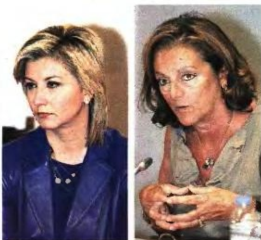
Η υφ. Υγείας Ζέττα Μακρή θα δημοσιοποιήσει σήμερα τα στοιχεία για την κακοδιαχείριση στον ΟΚΑΝΑ, αποκάλυψη η οποία οδήγησε στην παραίτηση της Μ. Μαλλιώρα.