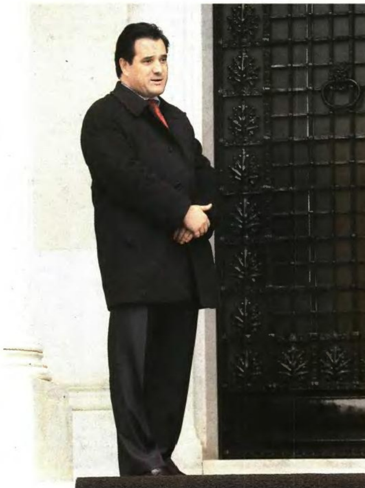
Ο Αδωνις Γεωργιάδης... στέκεται τιμωρία από τον πρωθυπουργό στα σκαλιά του Μαξίμου. Όταν οι συνδικαλιστές γιατροί βγήκαν από το μέγαρο Μαξίμου, πανηγύριζαν. Δύο ώρες μετά, σε ραντεβού του υπ. Υγείας με τους γιατρούς του ΕΟΠΥΥ, μάθαιναν το θλιβερό μαντάτο: ξεκινούν, άμεσα, οι διαθεσιμότητες!

Από την άλλη, οι συνδικαλιστές γιατροί του πρώην ΙΚΑ, νυν ΕΟΠΥΥ που γνωρίζουν καλά ότι έχουν χάσει το παιχνίδι εδώ και καιρό, επιμένουν να μιλήσουν για μια πρώτη νίκη μετά τη συνάντηση με τον πρωθυπουργό. Μια νίκη την οποία αποδίδουν στο γεγονός ότι ο Αδωνις Γεωργιάδης θα... υποχρεωθεί να κάνει διάλογο μαζί τους έστω και αν συνεχίσουν την απεργία τους. Βέβαια, είναι γνωστό σε κάθε πολιτή αυτή της χώρας πως αν ο πρωθυπουργός έχει διαφορετική άποψη από τον υπουργό του, δεν του τράβει το... αυτί αλλά απλώς του ζητεί την παραίτηση. Κάτι που στην προκειμένη περίπτωση δεν έχουμε.