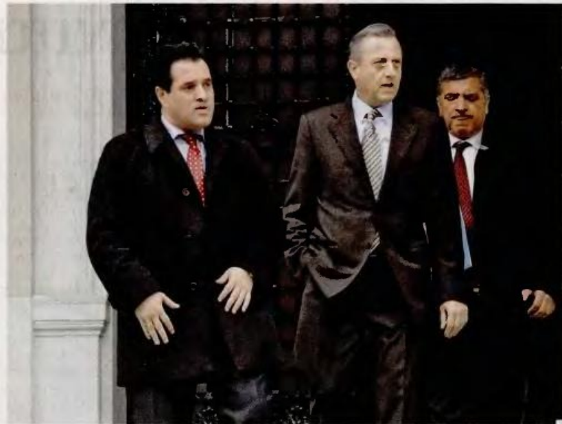
Ο υπουργός Υγείας Αδ. Γεωργιάδης, ο υφυπουργός Αντ. Μπέζας και ο πρόεδρος του Ιατρικού Συλλόγου Αθηνών Γ. Πατούλης, εξερχόμενοι του Μεγάρου Μαξίμου.