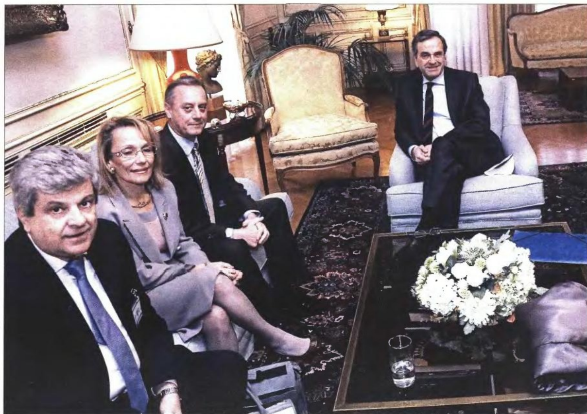
Ο πρωθυπουργός (κέντρο) και η ηγεσία του υπουργείου Υγείας (Αδωνις Γεωργιάδης και Αντώνης Μπέζας) με το προεδρείο του Πανελληνίου Ιατρικού Συλλόγου

Ο κ. Γεωργιάδης μάλιστα είπε ότι δεν θα γίνουν απολύσεις, όμως οι μεταρρυθμίσεις για την Πρωτοβάθμια Φροντίδα Υγείας (ΠΦΥ) θα