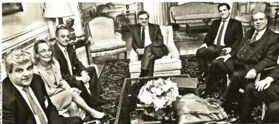
Ο Αντώνης Σαμαράς, ο υπουργός Υγείας Αδωνίς Γεωργιάδης και ο υφυπουργός Αντώνης Μπέζας κατά τη συνάντησή τους με το προεδρείο του Πανελληνίου Ιατρικού Συλλόγου και τον πρόεδρο του Ιατρικού Συλλόγου της Αθήνας

► Πιο ήπιος εμφανίστηκε ο Αντώνης Σαμαράς στη χθεσινή συνάντηση με τους γιατρούς. Έδειξε να αποδέχεται την επανέναρξη του διαλόγου από μηδενική βάση και δεν έθεσε προαπαιτούμενο τη λήξη της απεργίας