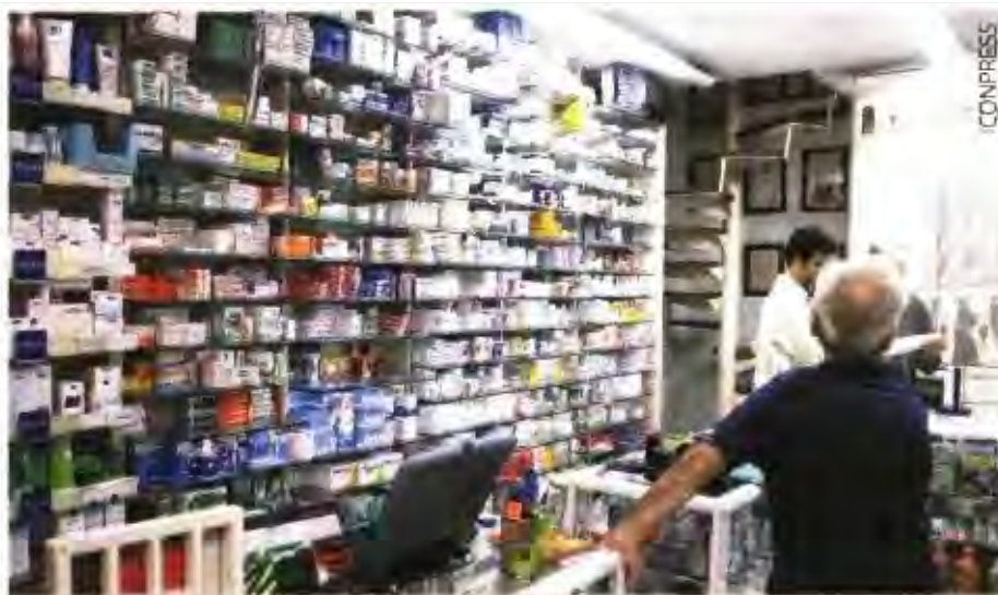
Το 52,3% των ερωτηθέντων στην έρευνα ανησυχεί για το εάν θα μπορέσει να καλύψει το κόστος των φαρμάκων του στα επόμενα 2 χρόνια.