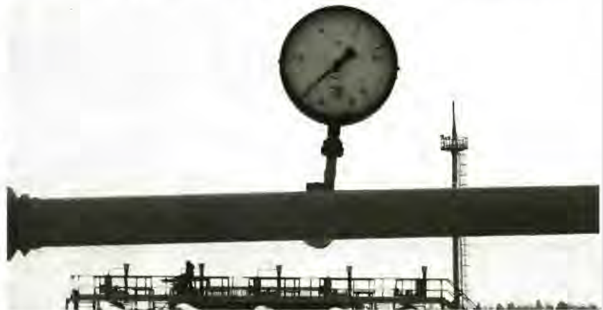
Συζητήσεις για την προμήθεια αερίου από το κοιτάσμα Σαχ Ντενίτζ του Αζερμπαϊτζάν ανακοίνωσε ο πρόεδρος και διευθύνων σύμβουλος της ΔΕΠΛ

Το 2013 θα είναι δύσκολη, αλλά μεταβατική χρονιά, εκτίμησε ο υφυπουργός Ανάπτυξης, Νότης Μπαταράκης, τονίζοντας ότι η Ελλάδα διέψευσε τις Κασσάνδρες που μιλούσαν