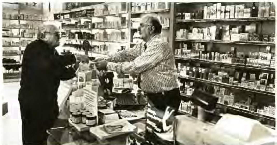
Με στόχο να πέσει ακόμη περισσότερο η φαρμακευτική δαπάνη, η τρόικα πιέζει για νέα μείωση στην τιμή των φαρμάκων

Όμως ο κλάδος της φαρμακοβιομηχανίας έχει δηλώσει ότι δεν θα δεχθεί περαιτέρω περικοπές στην τιμολόγηση. Ορισμένες φαρμακευτικές επιχειρήσεις προειδοποιούν με απο-