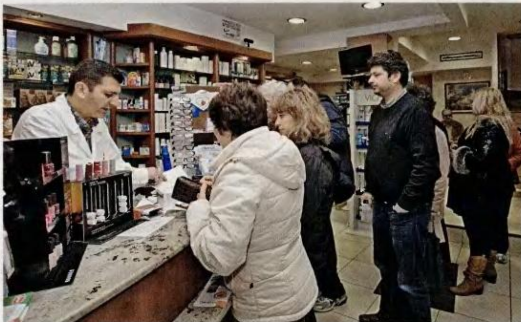
Σε αναστολή της επί πιστώσει χορήγησης φαρμάκων σε ασφαλισμένους Ταμείων, όταν τεθεί επί τάπητος θέμα μείωσης του ποσοστού κέρδους τους, προτίθεται να προχωρήσει ο Φαρμακευτικός Σύλλογος Αθηνών.