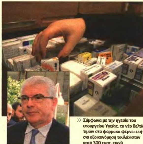
» Σύμφωνα με την ηγεσία του υπουργείου Υγείας, το νέο δελτίο τιμών στα φάρμακα φέρνει ετήσια εξοικονόμηση τουλάχιστον κατά 300 εκατ. ευρώ

Στη πρώτη συνάντηση του κ. Λυκουρέντζου με τους νέους διοικητές και υποδιοικητές των ΥΠΕ, ο