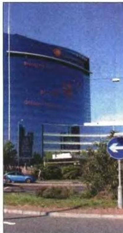
Η Irish Pharmaceutical Healthcare Association εκπροσωπεί μεγάλες φαρμακοβιομηχανίες όπως η GlaxoSmithKline

Σε κάθε περίπτωση, η συμφωνία με τις φαρμακοβιομηχανίες αποτελεί μία ανακούφιση για τον υπουργό, James Reilly, ο οποίος δέχεται έντονες επικρίσεις για τις υπερβάσεις του προϋπολογισμού στον τομέα της υγείας. Το έλλειμμα στην υγεία άγγιζε τα 374 εκατ. ευρώ στα τέλη του περασμένου μήνα.