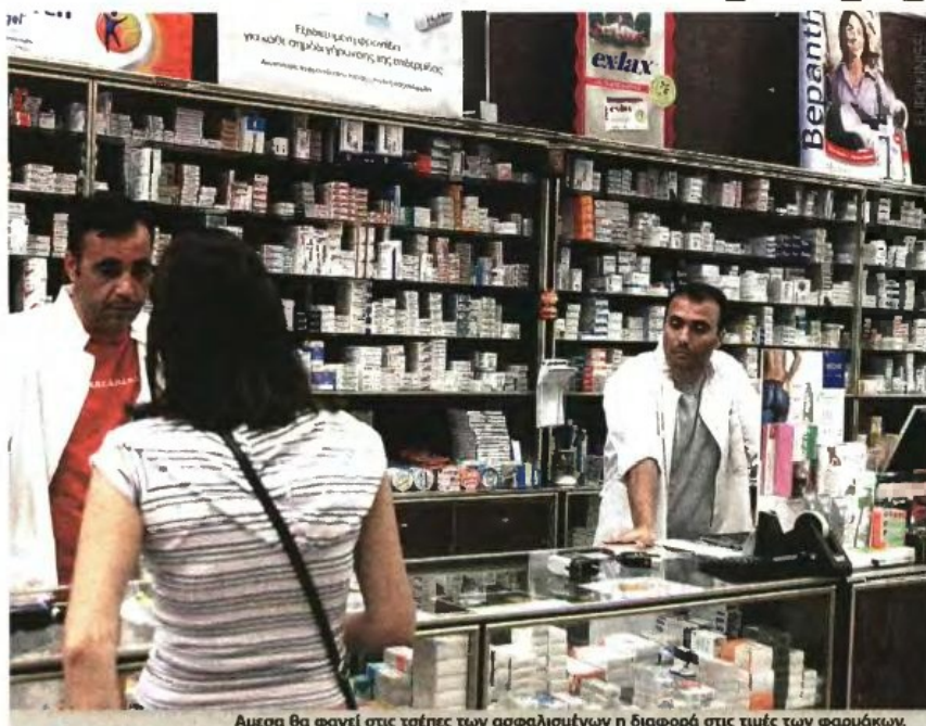
Άμεσα θα φανεί στις τσέπες των ασφαλισμένων η διαφορά στις τιμές των φαρμάκων.

ΜΑΡΙΑ ΤΣΙΛΙΜΙΓΚΑΚΗ mtsilimigaki@e-typos.com