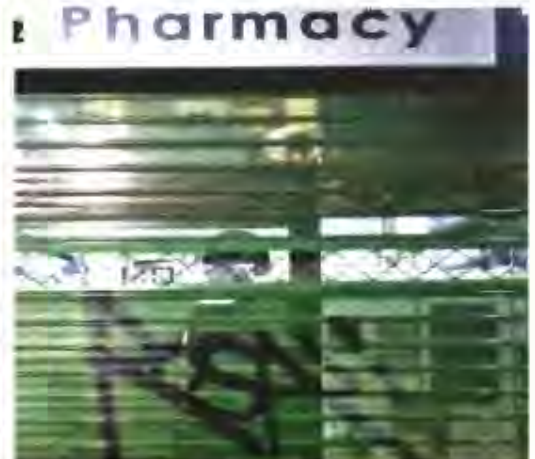
Ακατάλληλα ρολά και ανυπαρξία φωτισμού κάνουν δύσκολη τη ζωή όσων ψάχνουν εφημερεύοντα φαρμακεία

Εκτος των όσων προαναφέρθηκαν, πολλά φαρμακεία θεωρούν, όπως φαίνεται, την ανάρτηση των πινάκων ως μια τυπική διαδικασία και τους τοποθετούν όπου τους βολεύει, χωρίς να υπάρχουν οι προϋποθέσεις καλής ανάγνωσής τους από τους αναζητούντες εφημερεύοντα φαρμακεία. Υπάρχουν τα εξής διαπιστωμένα σοβαρά μειονεκτήματα, τα οποία εμποδίζουν τη λήψη πληροφοριών: • Ακατάλληλα ρολά, με πυκνό πλέγμα, το οποίο απαγορεύει την ανάγνωση. • Ρολά με μικρό άνοιγμα το οποίο επίσης δεν επιτρέπει ανάγνωση των πινάκων.