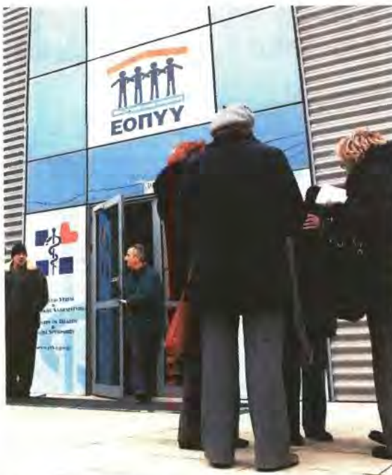
▲ ΠΑΝΩ από 1,5 δισ. ευρώ οφείλει ο ΕΟΠΥΥ σε φαρμακευτικές εταιρείες, γιατρούς, διαγνωστικά κέντρα και ιδιωτικές κλινικές