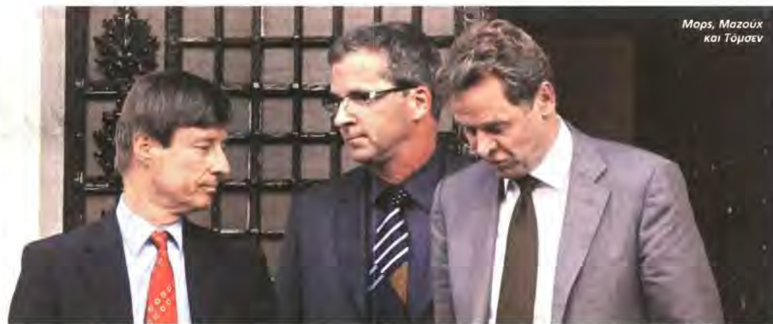
Μαρς, Μαζούκ και Τόμσεν

Πηγές του Μεγαρού Μαξίμου τόνισαν επίσης ότι: «Εάν η πρόταση της ΔΗΜΑΡ είναι πρακτικά εφαρμόσιμη, βεβαίως να τη βάλουμε στο τραπέζι των διαπραγματεύσεων με την τριόκτα», προσέθεταν όμως ότι: «Το θέμα είναι εάν θα συμφωνήσει η τριόκτα, γιατί εδώ δεν πρόκειται για ένα debate μεταξύ ημών», υπονοώντας ότι η τριόκτα έχει ήδη λάβει τις αποφάσεις της. Στο Μέγαρο Μαξίμου πάντως εξετάζονταν την πιθανότητα η ισορροπία του χαράτσιού να έρθει ως πράξη νομοθετικού περιεχομένου, για να αποφευχθούν «προσωρινά έστω» κόντρα στη Βουλή.