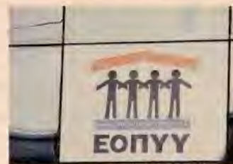
Για τον ΕΟΠΥΥ είχαν εγκριθεί πληρωμές 657 εκατ. ευρώ, αλλά δόθηκαν 160 εκατ.

Στο κρίσιμο σημείας ζήτημα της υστέρησης των πληρωμών «απαιτείται ένταση των προσπαθειών από τους χρηματοδοτούμενους φορείς» τόνισε χθες ο αναπληρωτής υπουργός Οικονομικών Χρ. Σταϊκούρας, σημειώνοντας πάντως ότι η κατάσταση βελτιώνεται. Για τους επόμενους μήνες, στελέχη του υπουργείου Οικονομικών ανέφεραν ότι οι αιτήσεις που είναι προς έγκριση από το ΓΛΚ ανέρχονται σε 1,2 δισ. ευρώ. Σελ. 18