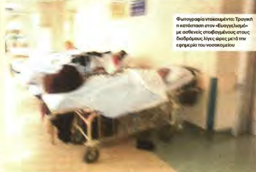
Φωτογραφία ντοκουμέντο: Τραγική η κατάσταση στον «Ευαγγελισμό» με ασθενείς στοιβαγμένους στους διαδρόμους λίγες ώρες μετά την εφημερία του νοσοκομείου

Κυριολεκτικά αναστενάζουν οι ασθενείς στα ελείγοντα των νοσοκομείων, καθώς μετά την περιπέτεια της τουλάχιστον εξάωρης αναμονής για την ιατρική τους εξέταση, αν χρειαστούν τελικώς νοσηλεία θα μεταφερθούν σε κάποιο φορείο και στον διάδρομο (φωτό).