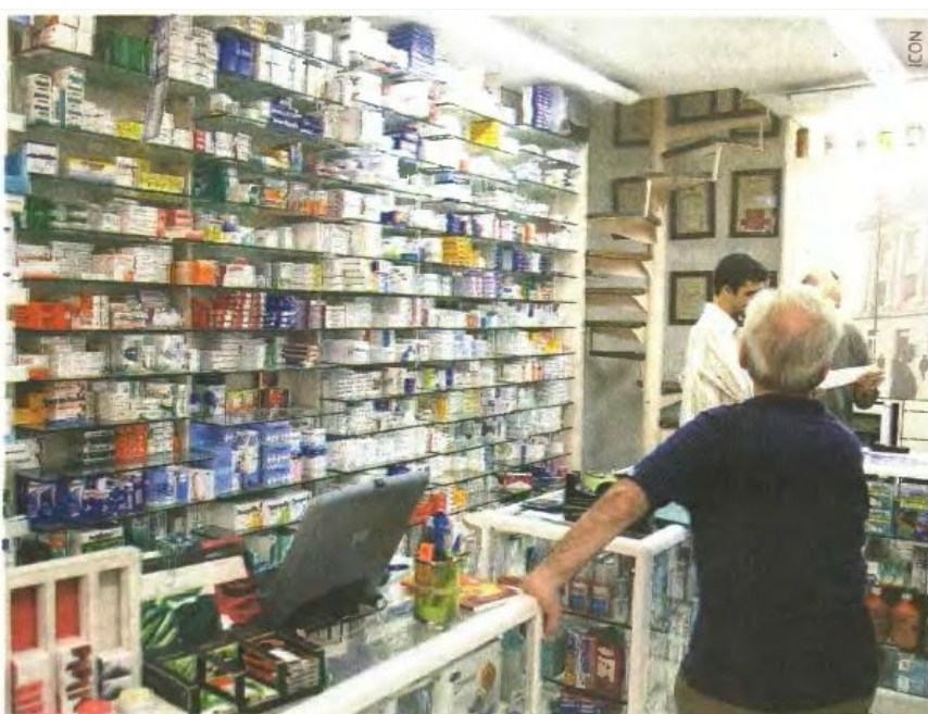
Στα φαρμακεία 450 νέα γενόσημα που περίμεναν τιμολόγηση από το 2011.

Τα καινοτόμα φάρμακα μένουν εκτός ελληνικής αγοράς (ΕΟΠΥΥ, νοσοκομεία και ιδιωτικά φαρμακεία) επειδή η εισαγωγή τους στη χώρα θα αύξανε τη δημόσια φαρμακευτική