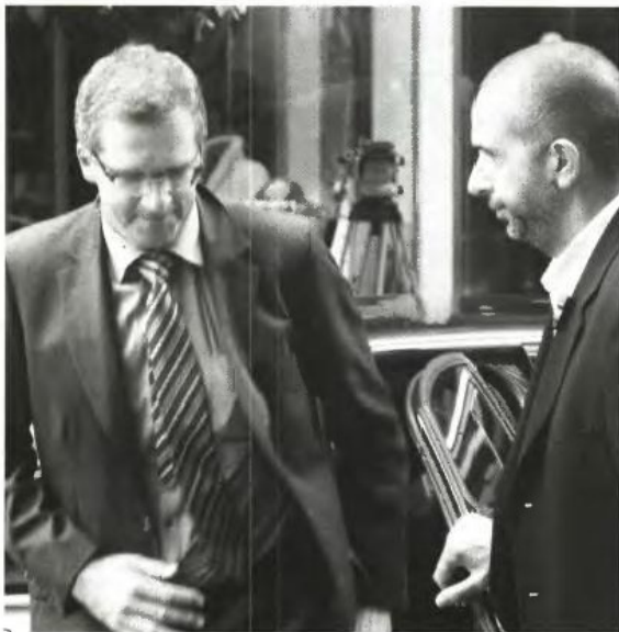
Σύμφωνα με πληροφορίες η τρόικα ζητάει μέτρα 8 δισ. ευρώ από μισθούς, συντάξεις και επιδόματα συν 1,5 δισ. ευρώ παρεμβάσεις αντίστοιχου άμεσου αποτελέσματος

Στη χθεσινή συνάντηση του υπουργού Οικονομικών με την τρόικα όπου συζητήθηκαν όλα τα καυτά θέματα της διαπραγμάτευσης μόλις λίγα εικοσιτετράωρα πριν από το χρονικό όριο της Κυριακής