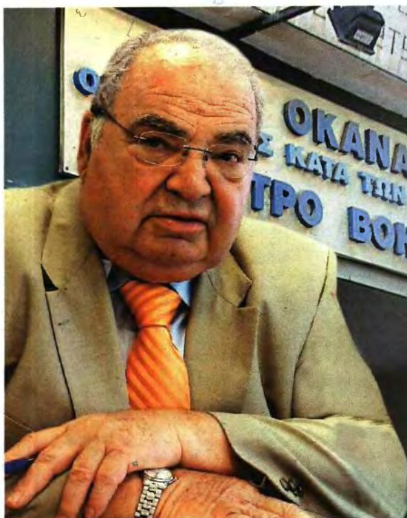
Ο Γενικός Επιθεωρητής Δημόσιας Διοίκησης Α. Ρακιντζής