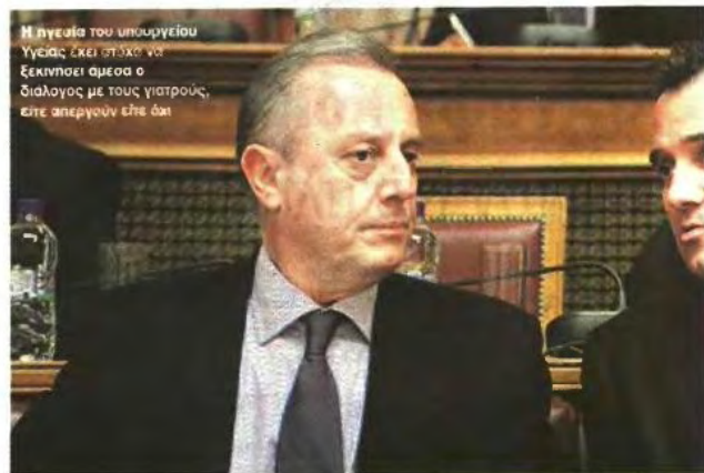
Η ηγεσία του υπουργείου Υγείας έχει στόχο να ξεκινήσει άμεσα ο διάλογος με τους γιατρούς, είτε απεργούν είτε όχι