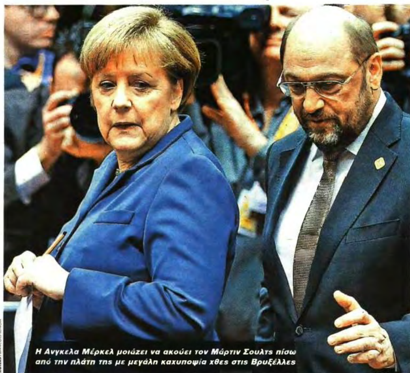
Η Ανγκελα Μέρκελ μοιάζει να ακούει τον Μάρτιν Σουλτς πίσω από την πλάτη της με μεγάλη καχυποψία χθες στις Βρυξέλλες