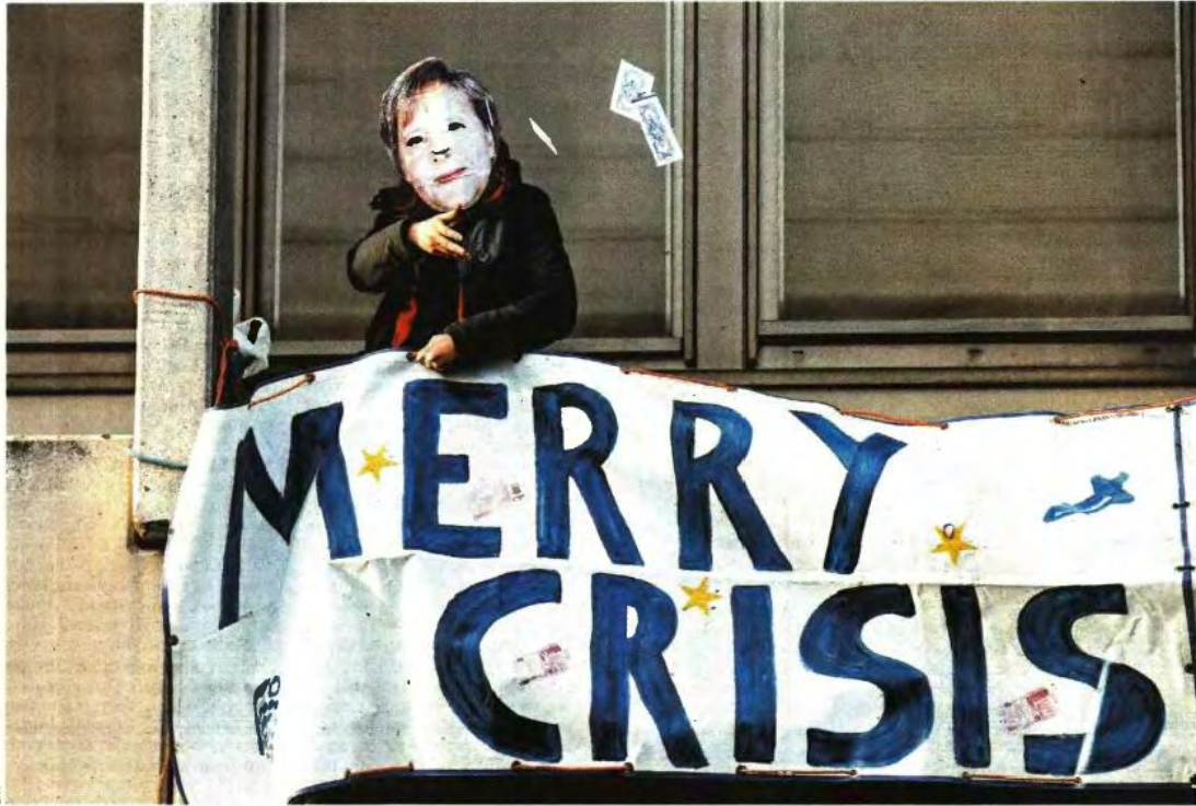
Με το προσωπείο της καγκελαρίου, ένας διαδηλωτής εύχεται «καλά κρισ-ούγεννα» στους ηγέτες της ΕΕ χτες στις Βρυξέλλες