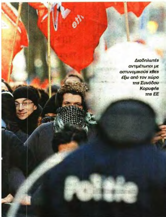
Διαδηλωτές αντιμετώπιζοι με αστυνομικούς χθες έξω από τον χώρο της Συνόδου Κορυφής της ΕΕ

Στη Σύνοδο Κορυφής οι ηγέτες συμφώνησαν να συνεργαστούν πιο στενά στον τομέα της αμυντικής βιομηχανίας. Τα θέματα της άμυνας συζητήθηκαν για πρώτη φορά τα τελευταία πέντε χρόνια σε επίπεδο ηγετών της ΕΕ. Οι ηγέτες κάλεσαν όλες τις χώρες να συνεργαστούν ώστε να μοιραστεί μεταξύ τους το υψηλό κόστος ανάπτυξης στρατιωτικού εξοπλισμού και να ενισχυθεί ο ρόλος των ευρωπαϊκών βιομηχανιών του κλάδου σε όλα τα κράτη της ενωμένης Ευρώπης.