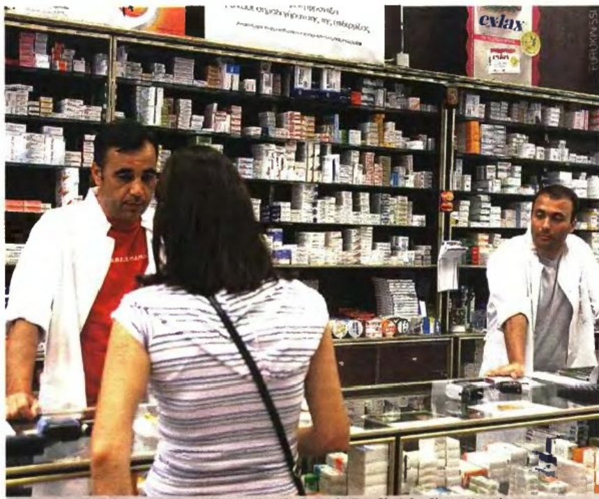
Το σύστημα για μηδενικό ΦΠΑ εφαρμόζεται σε Μεγάλη Βρετανία, Σουηδία, Ιρλανδία και Κροατία.

Ας μην ξεχνάμε ότι σε όλες τις προηγούμενες κινητοποιήσεις ένα από τα βασικά τους επιχειρήματα ήταν ότι δεν είναι δυνατόν να