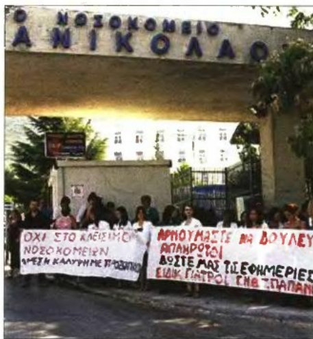
Από τις χθεσινές κινητοποιήσεις των γιατρών στο νοσοκομείο «Γ. Παπανικολάου» της Θεσσαλονίκης

Μέσω των εκπρόσωπων τους οι γιατροί ζητούν να ανοίξει εκτάκτως η