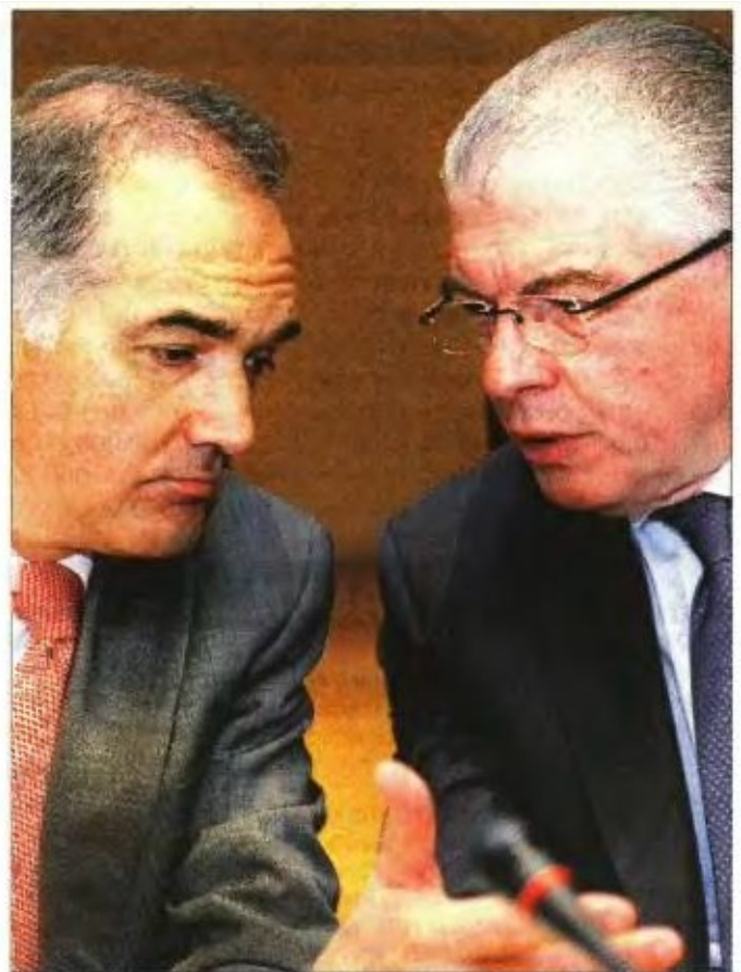
Ο υπουργός Υγείας Ανδρέας Λυκουρέντζος και ο αναπληρωτής υπουργός Υγείας Μάριος Σαλμάς στη χθεσινή ημερίδα της Εθνικής Σχολής Δημόσιας Υγείας