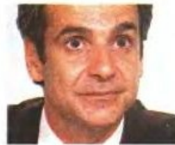
ΚΥΡ. ΜΗΤΣΟΤΑΚΗΣ Ενώπιος ενωπίω με τις απολύσεις