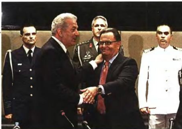
Ευδιάθετοι ο νυν και ο πρώην υπουργός Εθνικής Αμυνας, Δημήτρης Αβραμόπουλος και Πάνος Παναγιωτόπουλος αντίστοιχα, κατά την τελετή παράδοσης - παραλαβής του υπουργείου, η οποία έγινε χθες στο «Πεντάγωνο».

▼ Η παρουσία της κ. Φώφης Γεννηματά, της πρώτης γυναίκας που ανέλαβε στη χώρα μας τη θέση αναπληρώτριας υπουργού Αμυνας, ξεκάρωσε χθες στην τελετή παράδοσης-παραλαβής μεταξύ των κ.κ. Πάνου Παναγιωτόπουλου και Δημήτρη Αβραμόπουλου. Ο νέος υπουργός εξήρε το έργο του προκατόχου του, ενώ έκανε ιδιαίτερη αναφορά στις μισθολογικές μειώσεις των στελεχών. Στην ομιλία του ο κ. Παναγιωτόπουλος ανέφερε, μεταξύ άλλων, ότι στους δώδεκα μήνες της θητείας του σήκωσε «το βάρος μιας πολύ δύσκολης αλλά απαραίτητης για τη χώρα πολιτικής, νομίζω με επιτυχία».