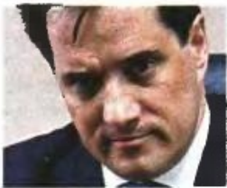
Α.Δ. ΓΕΩΡΓΙΑΔΗΣ Αντιμέτωπος με έλλειμμα 1 δισ. ευρώ