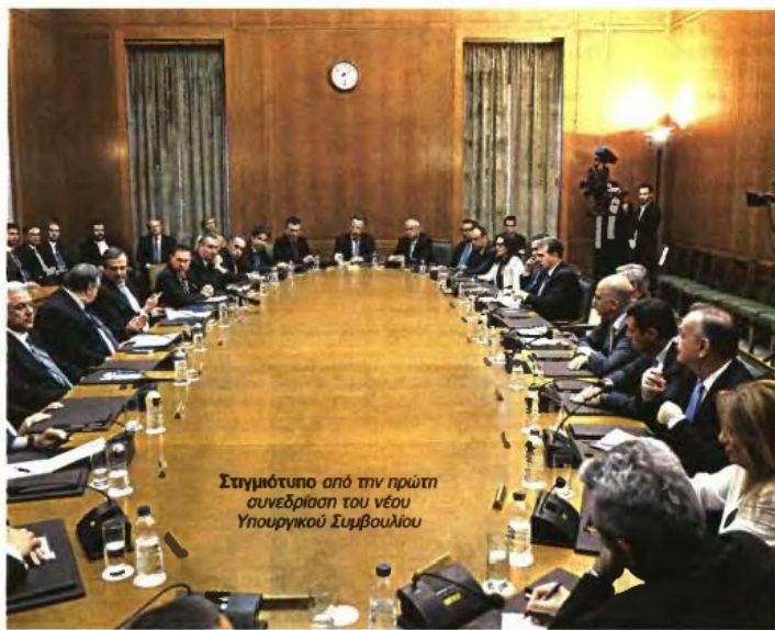
Στημμότυπο από την πρώτη συνεδρίαση του νέου Υπουργικού Συμβουλίου

Αναφερόμενος στη συνεργασία των δύο κομμάτων, ο πρωθυπουργός επισήμανε ότι ρε-