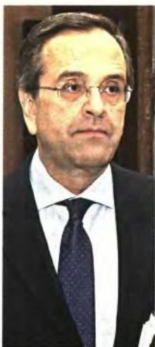
«Υπέριπτα ιδεολογία είναι η σωτηρία του τόπου. Μας ενώνουν τα μεγάλα και το ατίμιο, κάποιον ζουν στους εφιάλτες του χθεσ, δεν θα αφήσουμε να μας διαιρέσουν τα μικρά και το παρελθόν. Δεν έχουμε άλλη επιλογή, από το να πετύχουμε», υπογράμμισε ο Αντ. Σαμαράς.

Μήνυμα σε όλους όσους εκπνέουν τη συμφωνία ΝΔ-ΠΑΣΟΚ για συγκρότηση δικομματικής κυβέρνησης, αλλά και αποφασιστικότητας στην αντιμετώπιση των επείγων προβλημάτων της χώρας, έστειλε χθεσ ο πρωθυπουργός κατά την ομιλία του στην πρώτη συνεδρίαση του νέου Υπουργικού Συμβουλίου, ενώ ο αντιπρόεδρος της κυβέρνησης και υπουργός Εξωτερικών κατέγραψε την ανάγκη να υπάρξει ευρύτερη στήριξη στο κυβερνητικό έργο που έχουν να επιτελέσουν.