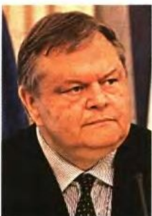
Ευάγγελος Βενιζέλος, αντιπρόεδρος και υπουργός Εξωτερικών: Εθνικό Σχέδιο Ανασυγκρότησης.

Την ίδια στιγμή, ο Ευάγγελος Βενιζέλος υπογράμμισε ότι «θα προχωρήσουμε με σταθερότητα, τα επόμενα τρία χρόνια, έως το τέλος αυτής της κοινοβουλευτικής περιόδου, της πιο κρίσιμης ίσως, τις τελευταίες δεκαετίες για τη χώρα μας».