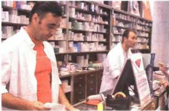
Για τα φαρμακεία η τρόικα επιμένει στην άρση των πληθυσμιακών κριτηρίων και το ποσοστό κέρδους το οποίο χαρακτηρίζει υψηλό.

[κλειστά επαγγέλματα] Μέχρι μέσα Ιανουαρίου