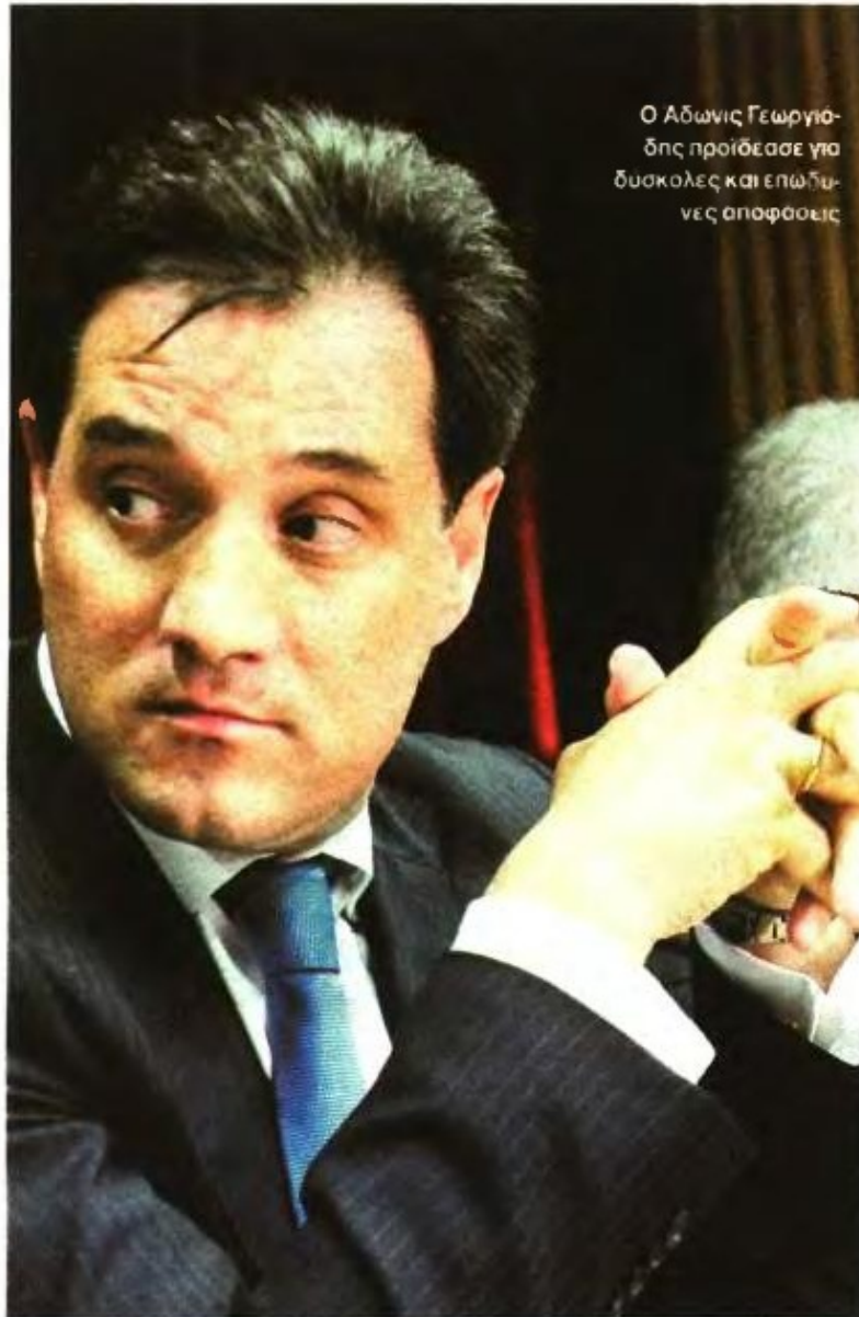
Ο Αδωνις Γεωργιάδης προέδρασε για δύσκολες και επώδυνες αποφάσεις

Μαξίμου για να του δώσει οδηγίες, περιμένει πολλά από την επιλογή του Αδ. Γεωργιάδη, για τον οποίο έχει εκφραστεί κολακευτικά για την αποτελεσματικότητά του.