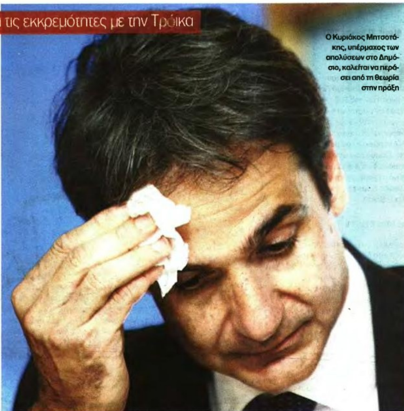
Ο Κυριάκος Μπιστοτάκης, υπέρμαχος των απολύσεων στο Δημόσιο, καλείται να περάσει από τη θεωρία στην πράξη

Παράλληλα ο κύριος Μπιστοτάκης θα πρέπει μαζί με τους υπουργούς Παιδείας Κ. Αρβανιτόπουλο και Εσωτερικών Γ. Μιχελάκη να βρουν τους 12.500 υπαλλήλους από τον χώρο της εκπαίδευσης και της Τοπικής Αυτοδιοίκησης που θα τεθούν σε καθεστώς διαθεσιμότητας, αποφεύγοντας τις κοινωνικές εκρήξεις και τις εσωκομματικές αναστα-