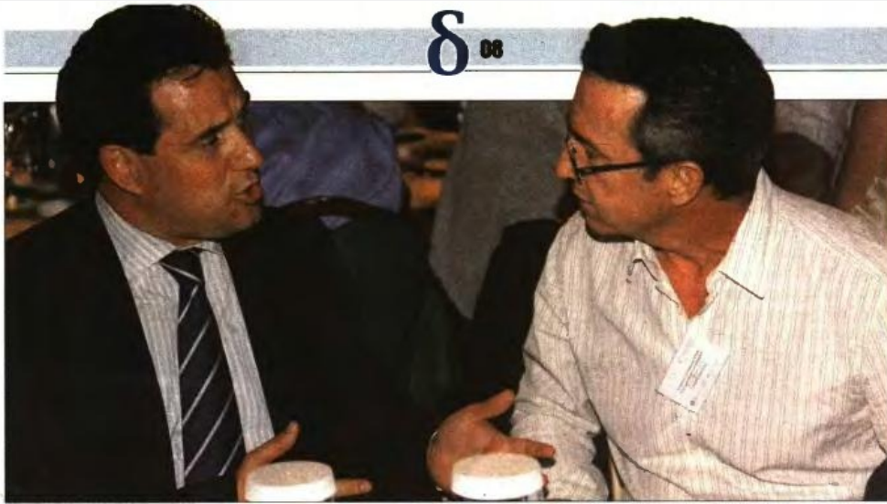
Ο υπουργός Υγείας Αδωνīs Γεωργιάδης συνομιλεί με τον υπό πειραίτηση πρόεδρο του ΕΟΦ Γιάννη Τσούγκα στη χθεσινή ημερίδα για την ηλεκτρονική συνταγογράφηση