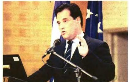
Μια γερή... ένεση από τα άσχημα του υπουργείου που ανέλαβε πήρε ο υπουργός Άδωνις Γεωργιάδης. Για το υπουργείο του αλλά και για τον ΕΟΠΥΥ ο χρόνος τρέχει και η Τρόικα πιέζει...

Η συνένωση έξι ελλειμματικών ταμείων περνάει βρόχο στον Οργανισμό και προκαλεί αγωνία στους ασφαλισμένους