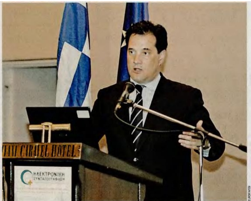
Ο νέος υπουργός Υγείας κατά τη χθεσινή ομιλία του στην ημερίδα για την ηλεκτρονική συνταγογράφηση. Ο κ. Γεωργιάδης χαρακτήρισε ως «τη μεγαλύτερη αποτυχία να χρειαζόμαστε την τρόικα για να κάνουμε τα αυτονόητα».

Το θέμα της αλλαγής διοίκησης στον ΕΟΠΥΥ συζητήθηκε και προχθές στην απογευματινή σύσκεψη στο Μέγαρο Μαξίμου, στην οποία συμμετείχαν οι νέοι υπουργοί των κρίσιμων τομέων με «ανοικτά μέτωπα» σε σχέση με την τρόικα. Το έλλειμμα φέτος του ΕΟΠΥΥ εκτιμάται ότι θα ξεπεράσει το ένα δισ. ευρώ, μέρος του οποίου αφορά την αδυναμία συγκράτησης «εντός στόχων» των δαπανών για διαγνωστικές εξετάσεις και ιδιωτικές κλινικές. Στο πλαίσιο αυτό οι επικεφαλής της τρόικας έχουν ζητήσει τη λήψη άμεσων μέτρων. Μεταξύ αυτών είχαν προκριθεί από την προηγούμενη ηγεσία η θέσπιση autolan back (επιστροφή υπέρβασης δαπάνης σε ΕΟΠΥΥ) σε διαγνωστικά κέντρα και ιδιωτικές κλινικές και η εφαρμογή δια-