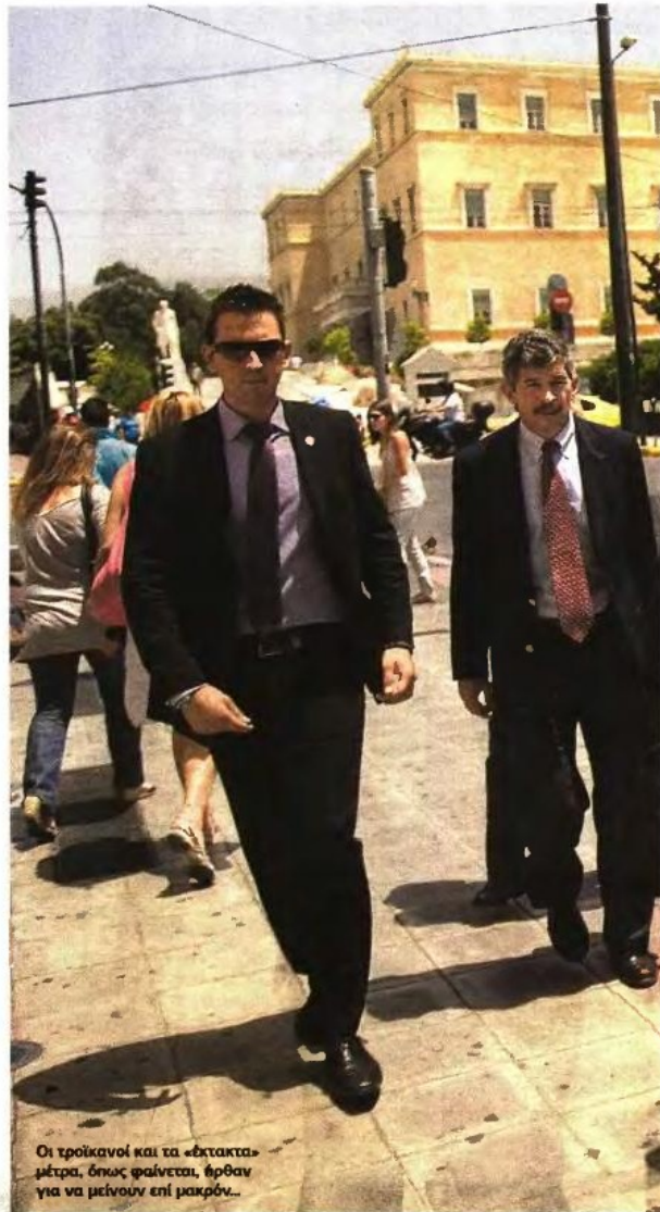
Οι τρόικανοί και τα «έκτακτα» μέτρα, όπως φαίνεται, ήρθαν για να μείνουν επί μακρόν...

11 Ζητούν τη δημιουργία «πιο λιτών, αποδοτικών, ανταγωνιστικών και επαρκώς κεφαλαιοποιημένων» τραπεζικών ομίλων. Ειδικότερα ορίζεται ότι η πώληση σημαντικού ποσοστού του μετοχικού κεφαλαίου της Eurobank σε διεθνείς επενδυτές πρέπει να γίνει ως το τέλος Μαρτίου του 2014. Ως το τέλος του 2013 θα βγουν τα αποτελέσματα των stress tests που έχουν ήδη ξεκινήσει. ■