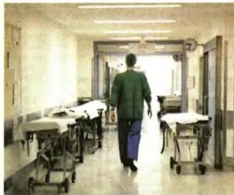
Οι πρώτοι που μετακινούνται είναι οι εργαζόμενοι στα νοσοκομεία που θα αλληλάξουν χαρακτήρα

Συνολικά, πάντως, έως το τέλος του χρόνου θα έχουν μπει σε καθεστώς «πάγου» περίπου 1.230 άτομα, ενώ οι πρώτοι θα επανενταχθούν στο σύστημα περί τα τέλη Σεπτεμβρίου, όπως διαβεβαιώνει η ηγεσία του υπουργείου Υγείας. Οι εργαζόμενοι θα μετακινηθούν σε δομές στις οποίες σήμερα υπάρχουν κενά, και κυρίως όσοι προέρχονται από μικρά νοσοκομεία θα μεταφερθούν στα μεγαλύτερα, στα οποία θα συγχωνευθούν οι