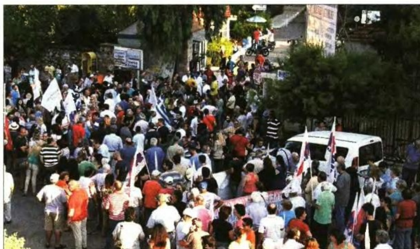
Διαμαρτυρία γιατρών και εργαζομένων έξω από το Γενικό Νοσοκομείο Δυτικής Αττικής για τις μετακινήσεις σε άλλα νοσηλευτικά ιδρύματα

Το ερχόμενο δεκαπενθήμερο θα ξεκινήσει η κινητικότητα στα έξι νοσοκομεία που πρόκειται να αλλάξουν χαρακτήρα