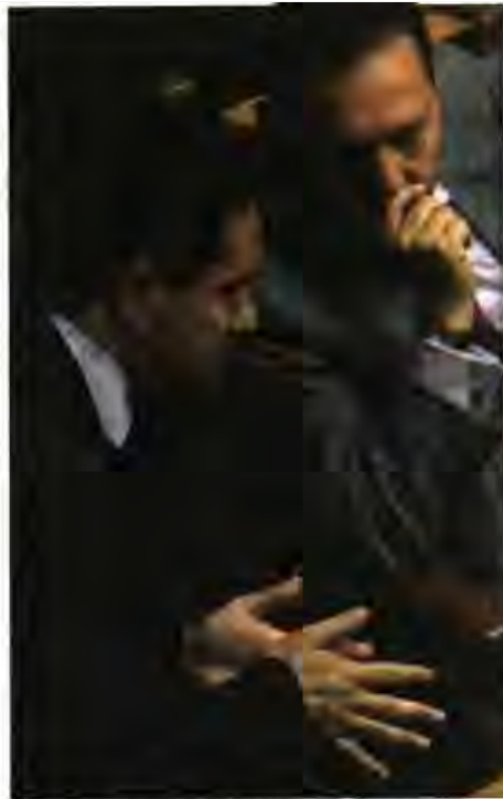
Ο υπ. Υγείας Α. Γεωργιάδης με τον υπ. Οικονομικών Ι. Στουρνάρα. Η ανακοίνωση του γραφείου Τύπου του γερμανικού υπουργείου όπως μεταφράστηκε στα ελληνικά

Σύμφωνα λοιπόν με τον υπουργό Υγείας Ντάνιελ