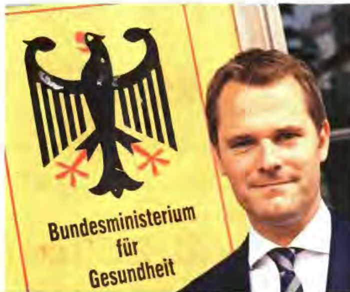
Πώς να μη μειδιά ο Daniel Bahr, ο υπουργός Υγείας της Γερμανίας...

Περιχαρής ο Γερμανός υπουργός Υγείας Daniel Bahr, ως... επικεφαλής του συγκεκριμένου τομέα, επιβεβαιώνει ότι θα ληφθούν επιπλέον μέτρα στο ΕΣΥ: «Η περαιτέρω αποτελεσματικότητα θα εξαρτηθεί ουσιαστικά από την άμεση λήψη μέτρων, προκειμένου να βοηθηθεί το σύνολο του ελληνικού πληθυσμού το συντομότερο δυνατό. Η επίτευξη δομικών και διαχρονικών με-