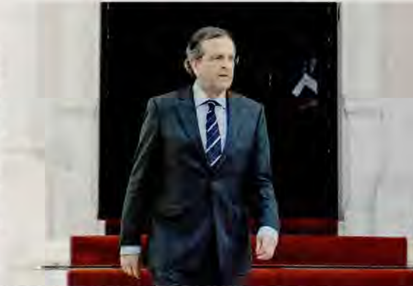
Σύσκεψη. υπό τον πρωθυπουργό Αντ. Σαμαρά, πραγματοποιήθηκε χθες στο Μέγαρο Μαξίμου με τη συμμετοχή των υπουργών Υγείας Αδ. Γεωργιάδη, Εργασίας Ιω. Βρούτση και του επικεφαλής του ΕΟΠΥΥ Δημ. Κοντού.

στο Μέγαρο Μαξίμου υπό τον κ. Αντώνη Σαμαρά με τη συμμετοχή των υπουργών Υγείας Αδ. Γεωργιάδη, Εργασίας Ιω. Βρούτση και του επικεφαλής του ΕΟΠΥΥ, Δημ. Κοντού. Κατά πληροφορίες, ο κ. Σαμαράς ζήτησε να υπάρξει εντατικοποίηση των προσπαθειών προκειμένου να επιταχυνθεί η διαδικασία, η οποία -όπως προκύπτει- «κολλάει» στην οργανωτική ανεπάρκεια των ασφαλιστι-