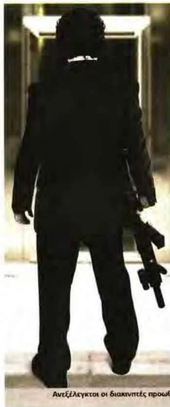
Ανεξέλεγκτοι οι διακινήτες προωθούν τα παράνομα εμπόρευματα. Εξαιρείται το πορνογραφικό υλικό, ενώ δεν επιτρέπονται συναλλαγές συμβολαίων θανάτου.