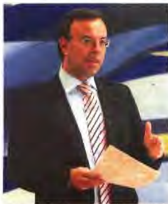
Ο αναπληρωτής υπουργός Οικονομικών, Χρήστος Σταϊκούρας.

Ο ΕΟΠΥΥ και οι δήμοι εξακολουθούν να αποτελούν τους «αδύναμους κρίκους» στην προσπάθεια να επιτακυνθεί η εξόφληση των ληξιπρόθεσμων οφειλών του Δημοσίου, σύμφωνα με τα τελευταία στοιχεία που παρουσίασε χθες ο αναπληρωτής υπουργός Οικονομικών, Χρήστος Σταϊκούρας, ο οποίος επίσης σημείωσε συναγερμό για τα νέα ληξιπρόθεσμα χρέη που εξακολουθούν να δημιουργούνται στον τομέα της Υγείας.