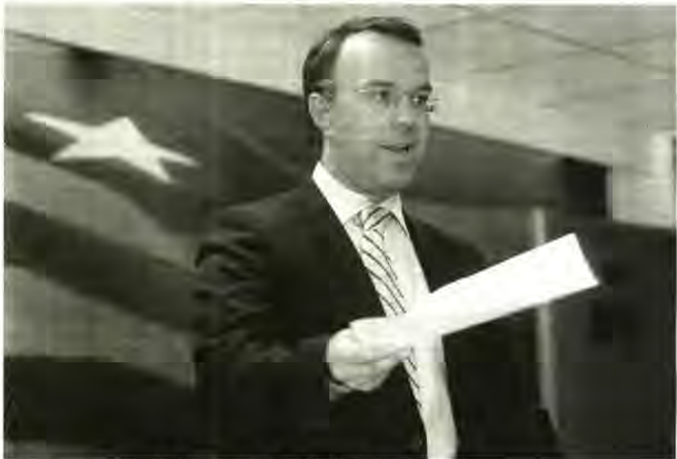
Ο αναπληρωτής υπουργός Οικονομικών κ. Χρ. Σταϊκούρας

έχει ολοκληρώσει τη χρηματοδότηση αιτημάτων ύψους 4,6 δισ. ευρώ, ικανοποιώντας περίπου το 85% των αιτημάτων των υπουργείων, ενώ βρίσκεται σε διαδικασία αξιολόγησης και επίκειται η ολοκλήρωση αιτημάτων ύψους 800 εκατ. ευρώ.