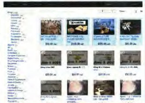
Στο «Atlantis» εκτός από ναρκωτικά μπορεί να αγοραστεί κόποιος και κωδικούς πιστωτικών καρτών...