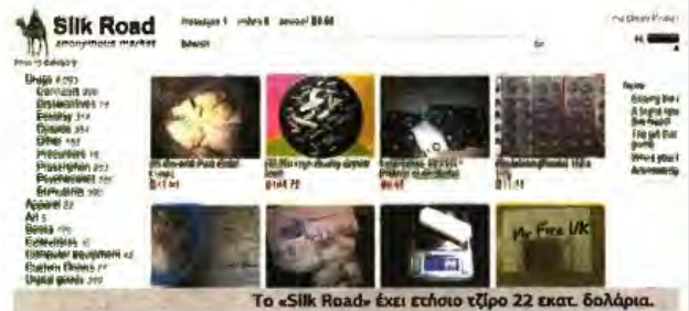
Το «Silk Road» έχει ετήσιο τζίρο 22 εκατ. δολάρια.

Η εγγραφή των χρηστών και στα δύο ηλεκτρονικά καταστήματα είναι δωρεάν, ενώ για τις online συναλλαγές μπορούν να χρησιμοποιήσουν και ψηφιακά νομίσματα, όπως αυτό του Bitcoin ή του αντίπαλου δέους Litecoin. Σύμφωνα, πάντως, με τους ιδρυτές των δύο ιστοσελίδων, υπάρχει... περιορισμός σε αυτά που μπορεί να αγοράσει ένας χρήστης, καθώς δεν επιτρέπονται συναλλαγές συμβολαίων θανάτου ή υλικού με πορνογραφικό περιεχόμενο. ■