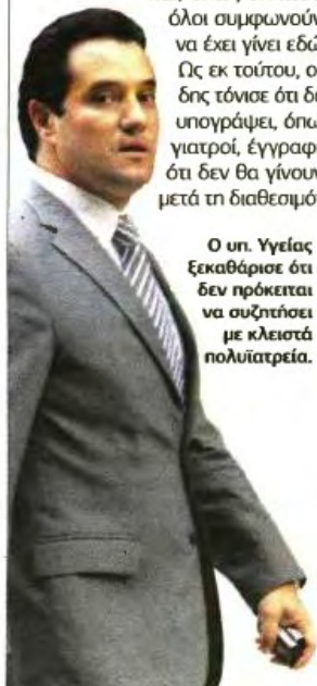
Ο υπ. Υγείας ξεκαθάρισε ότι δεν πρόκειται να συζητήσει με κλειστά πολυιατρεία.

Εν τω μεταξύ, θα ανοίξουν και τα εξωτερικά ιατρεία όλων των δημόσιων νοσοκομείων ώστε να βοηθήσουν την πρωτοβάθμια όσο διαρκεί το μεταβατικό στάδιο. Για τους γιατρούς του ΕΟΠΥΥ που απεργούν, ο κ. Γεωργιάδης εξάλλου ξεκαθάρισε ότι δεν γνωρίζει ακόμα πόσοι δεν θα απορροφηθούν, καθώς το σχετικό πόρισμα θα είναι στα χέρια του αύριο Παρασκευή, αλλά αφενός δεσμεύτηκε ότι όλοι οι νοσηλευτές και διοικητικοί θα μείνουν στη διαθεσιμότητα περί τις 15 με 25 ημέρες και θα επαναπροσληφθούν, αφετέρου ότι οι γιατροί θα έχουν τη δυνατότητα σύμβασης στα ιδιωτικά τους ιατρεία και τη δυνατότητα υποβολής αίτησης για πρόσληψη στο ΕΣΥ ώστε να μη μείνουν άνεργοι. «Αλλά αυτό το τελευταίο δεν θα ισχύσει αν δεν σταματήσουν την απεργία», συμπλήρωσε. ■