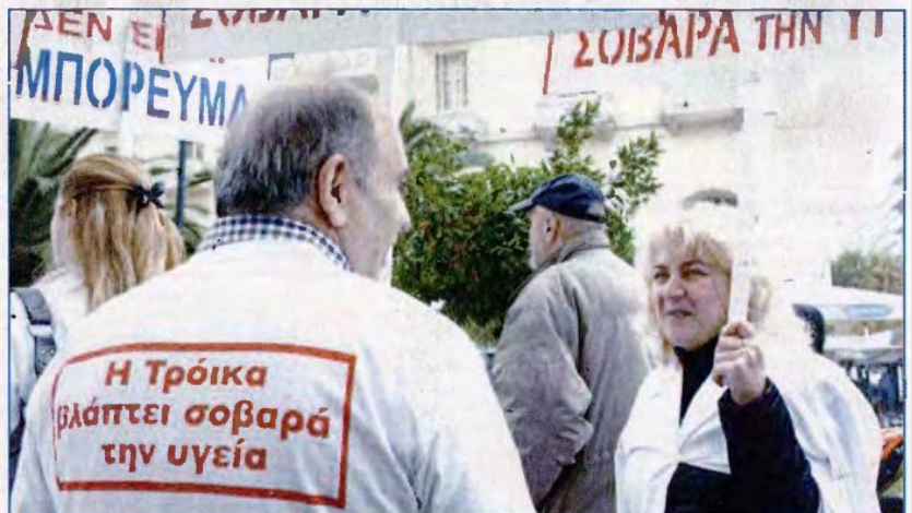
Η εντολή της Τρόικας εκτελείται κατά γράμμα... Ο Έλληνας κάνει το πολυτιμότερο αγαθό του, την υγεία. Καθημερινά βρίσκεται αντιμέτωπος με ένα όλο και πιο απάνθρωπο σύστημα. Η Τρόικα βλάπτει σοβαρά την υγεία!..

Σε Γολγοθά για τους ασφαλισμένους έχει μετατραπεί η περίθαλψη στη χώρα, ενώ δεν είναι λίγοι οι ασθενείς, που λόγω των τραγικών ελλείψεων στα νοσοκομεία, αλλά και στον ευρύτερο τομέα υγείας (ΕΟΠΥΥ), ΣΥΝΕΧΕΙΑ ΣΤΗ ΣΕΛ. 7