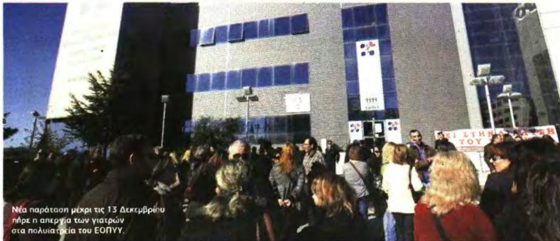
Νέα παράταση μέχρι τις 13 Δεκεμβρίου πήρε η απεργία των γιατρών στα πολυιατρεία του ΕΟΠΥΥ.

Α. ΓΕΩΡΓΙΑΔΗΣ: ΑΥΞΗΣΗ ΕΠΙΣΚΕΨΕΩΝ ΣΤΑ ΣΥΜΒΕΒΛΗΜΕΝΑ ΙΔΙΩΤΙΚΑ ΙΑΤΡΕΙΑ