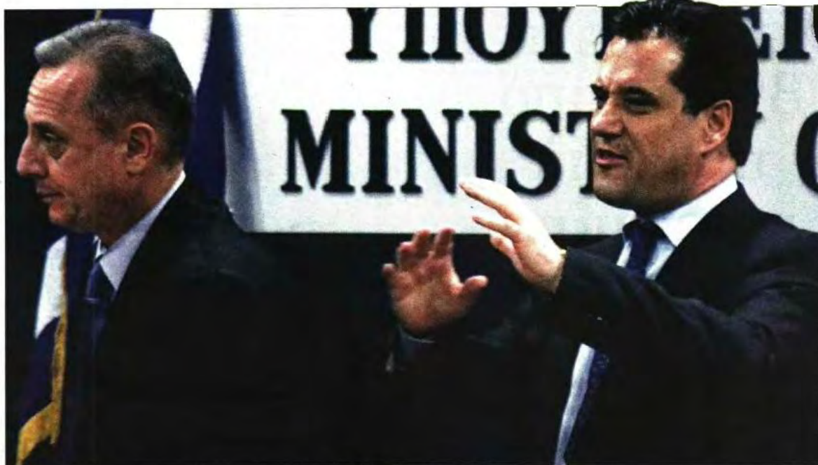
Ο υπουργός Υγείας Αδωνης Γεωργιάδης και ο υφυπουργός Αντώνης Μπέζας κατά τη διάρκεια χθεσινής συνέντευξης στους δημοσιογράφους

«Το αρχικό σχέδιο προέβλεπε ότι σε όσους κριθεί ότι δεν μπορούν να συνεχίσουν θα δίνανε εναλλακτικά σύμβαση στον ΕΟΠΥΥ. Εφόσον η απεργία δεν λήγει, αυτή η προσφορά δεν ισχύει. Η μεταρρύθμιση θα γίνει πολύ γρηγορότερα και ας απεργούν σε διαθεσιμότητα. Υπολογίζαμε ότι χρειαζόμαστε έξι μήνες για την ολοκλήρωση της διοικητικής μεταβολής, με σπατάλες διαθεσιμότητες. Πιλέ-