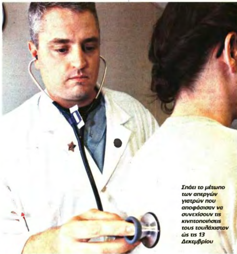
Σπάζει το μέτωπο των απεργών γιατρών που αποφάσισαν να συνεχίσουν τις κινητοποιήσεις τους τουλάχιστον ως τις 13 Δεκεμβρίου

Το σύνθετο πηλαφόν των 200 επισκέψεων κατορθώνουν και