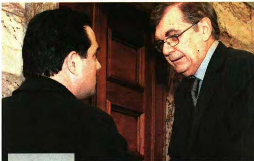
Ο υπουργός Υγείας Αδωνις Γεωργιάδης (αριστερά) συνομιλεί με τον πρόεδρο της Επιτροπής Κοινωνικών Υποθέσεων Δημήτρη Κρεμαστινό κατά τη διάρκεια της χθεσινής συνεδρίασης

απόφαση των γιατρών του ΕΟΠΥΥ να κλιμακώσουν τις απεργιακές τους κινητοποιήσεις με τη φράση ότι «αν η απεργία συνεχιστεί, θα πάμε τη μεταρρύθμιση πολύ γρηγορότερα, και ως απεργούν σε διαθεσιμότητα». Ο ίδιος μάλιστα επισήμανε ότι «η κυβέρνηση και η κοινωνία δεν εκβιάζεται από καμία επαγγελματική ομάδα ή συντεχνία», και πρόσθεσε ότι «εκβιασμοί τέτοιου είδους ότι εμείς θα απεργούμε στον αιώνα των άπαντα εάν το υπουργείο δεν υπογράψει χαρτί ότι εξαιρούμαστε από την κινητικότητα, δεν μπορούν να γίνουν ανεκτοί», ξεκαθάρισε ο κ. Γεωργιάδης.