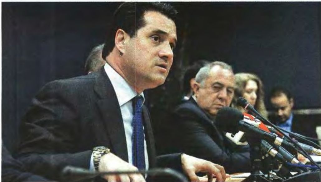
▲ ΑΠΟΦΑΣΙΣΜΕΝΟΣ να προχωρήσει στις αλλαγές δηλώνει ο υπουργός Υγείας Α. Γεωργιάδης αν μέχρι την Τετάρτη δεν προσέλθουν σε διάλογο οι γιατροί. Οι ίδιοι, πάντως, παρατείνουν τις κινητοποιήσεις έως και τις 13 Δεκεμβρίου