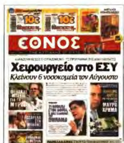
▲ ΤΟ «ΕΘΝΟΣ» της Κυριακής στις 21 Ιουλίου είχε παρουσιάσει το σχέδιο για τις συγχωνεύσεις νοσοκομείων

γηση των φορέων, στις 23 Αυγούστου θα δημοσιευθεί ο κατάλογος με τα ονόματα όσων θα θεθούν σε καθεστώς κινητικότητας, μέχρι τις 30 Αυγούστου οι εργαζόμενοι θα κληθούν να δηλώσουν τις προτιμήσεις τους ως προς τη μετακίνηση και έως τις 16 Σεπτεμβρίου θα έχει ολοκληρωθεί