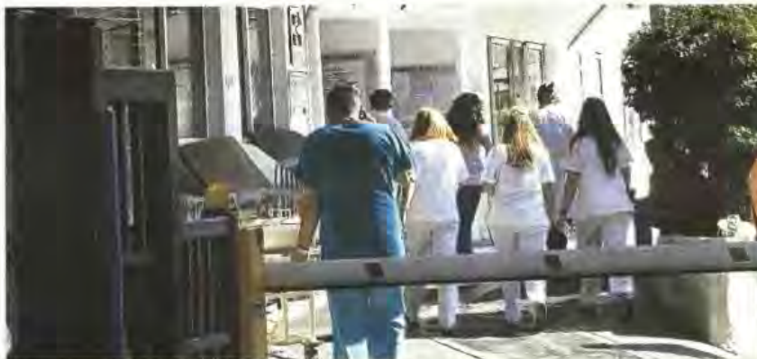
Στην κινητικότητα θα ενταχθούν 1.618 εργαζόμενοι, ανάμεσά τους και 300 γιατροί.

Ηδη, έχει μεταφερθεί και συγχωνευθεί στο Θριάσιο η Ουρολογική Κλινική της Πολυκλινικής. Επιπλέον προτείνονται η μεταφορά του παθολογικού τμήματος στον «Ευαγγελισμό», η λειτουργία του τμήματος Παθολογικού/Αποθεραπείας, υποστηρικτική στον «Ευαγγελισμό», όπου θα γίνει επίσης η μεταφορά του ενδοκρινολογικού, του ΩΡΛ, διαβητολογικού, γυναικολογικού, αναισθησιολογικού, ακτινολογικού και του μικροβιολογικού τμήματος, ενώ του οφθαλμολογικού τμήματος η μεταφορά θα έχει αποδέκτη το Λαϊκό, του