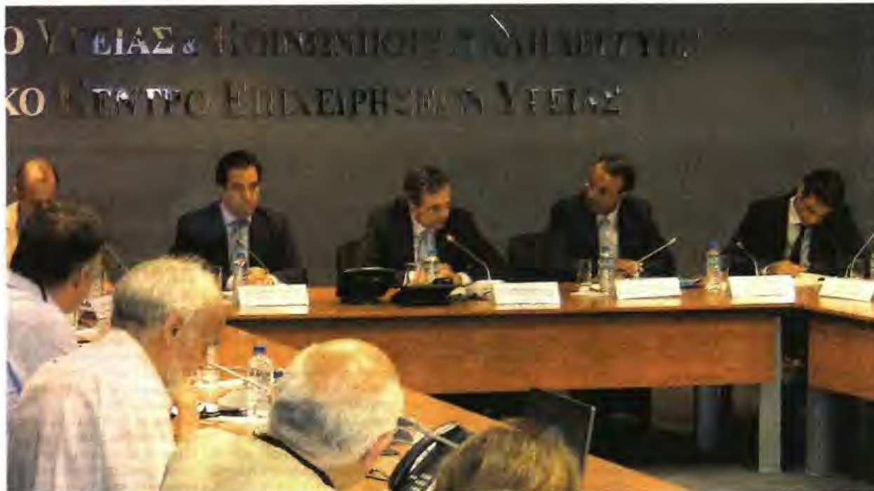
▲ «Η ΕΛΛΑΔΑ ΕΙΝΑΙ σαν την έρημο που περιμένει μια στάλα βροχής. Και τα ληξιπρόθεσμα είναι αυτή η στάλα. Μην τα καθυστερείτε», υπογράμμισε ο Αντ. Σαμαράς στη διυπουργική σύσκεψη για τις οφειλές του ΕΟΠΥΥ στέλλοντας καθαρό μήνυμα στους διοικητές των Ταμείων