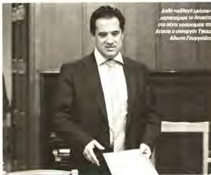
Αληθινή «αλλαγή κλίσης» χαρακτήρισε το Ρουκέτο στα πέντε νοσοκομεία της Αττικής ο υπουργός Υγείας Αδωνής Γεωργιάδης

Τα 600 αυτά κρεβάτια προστίθενται σε ακόμα 600 που διαγράφηκαν από τον χάρτη της υγείας τη χρονιά