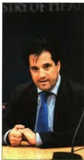
>> Ο υπουργός Υγείας Αδωνις Γεωργιάδης

Σύμφωνα με τα στοιχεία που παρουσίασε ο Μπέζας, συνολικά έως το τέλος Αυγούστου η ληφθείσα χρηματοδότηση για την αποπληρωμή των ληξιπρόθεσμων ο-