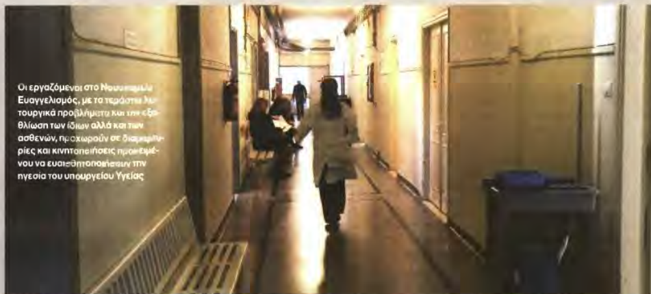
Οι εργαζόμενοι στο Νοσοκομείο Ευαγγελισμός, με τα τεράστια λειτουργικά προβλήματα και την «εφθάλωση των ίδιων αλλά και των ασθενών, προχωρούν σε διαμαρτυρίες και κινητοποιήσεις προκειμένου να ευαισθητοποιήσουν την ηγεσία του υπουργείου Υγείας

Στα όρια της υπερκόπωσης βρίσκεται και το εργατικό δυναμικό του νοσοκομείου, αφού 1.500 οργανικές θέσεις παρα-