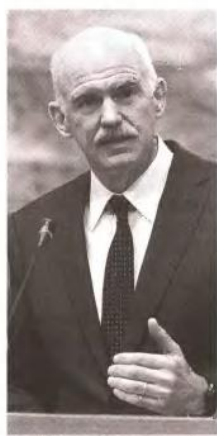
Τη δυσάρεσκεια υπουργών και στελεχών του ΠΑΣΟΚ προκάλεσαν οι χειρισμοί Παπανδρέου.