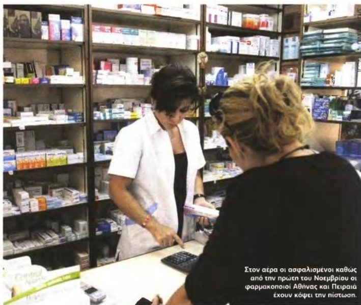
Στον αέρα οι ασφαλισμένοι καθώς από την πρώτη του Νοεμβρίου οι φαρμακοποιοί Αθήνας και Πειραιά έχουν κόψει την πίστωση.

Εντολή από το υπ. Οικονομικών να μην εκταμιεύονται ποσά για άλλες δαπάνες, πλην μισθών και συντάξεων