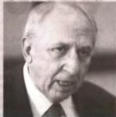
Παραμένει υπ. Οικονομικών ο Βενιζέλος, πιθανότατα αντικαθίστανται οι Μπεγλίτης, Καστανίδης, Παπουτσής (φωτό) και ο Γ. Μουρμούρας, Κ. Αρβανιτόπουλος φέρονται ως επικρατέστεροι να συμμετάσχουν στο νέο σχήμα από τη Ν.Δ. Πιθανή υπουργοποίηση