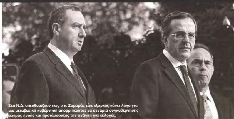
Στη Ν.Δ. υπενθυμίζουν πως ο κ. Σαμαράς είχε εξαρχής κάνει λόγο για μια μεταβατική κυβέρνηση απορριπτόντας τα σενάρια συγκυβέρνησης μακράς πνοής και προτάσσοντας την ανάγκη για εκλογές.

ΟΙ ΡΑΓΔΑΙΕΣ πολιτικές εξελίξεις αποτελούν σαφή νίκη του Αντώνη Σαμαρά και δικαίωση της στάσης που κράτησε όλο το τελευταίο διάστημα. Στη Ν.Δ. επισφραγίζουν με νόημα πως μόλις δύο χρόνια μετά από τις εκλογές του 2009 και τη συντριβή της παράταξης, το ΠΑΣΟΚ δεν βρίσκεται πλέον στην εξουσία και ο Γιώργος Παπανδρέου δεν είναι πρωθυπουργός. Υπενθυμίζουν μάλιστα πως αυτά τα δύο χρόνια η Ν.Δ. άλλαξε ηγεσία, υπήρξε η αποχώρηση της κ. Μπακογιάννη με μικρό αριθμό στελεχών της και παρά το γεγονός ότι κάποιοι έκαναν λόγο ακόμα και για διάσπαση, τελικά το κόμμα όχι μόνο πήκε μπροστά στις δημοσκοπήσεις και με διαφορά αλλά κατάφερε να ηγηθεί των εξελίξεων.