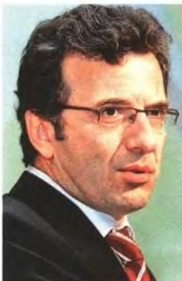
Ο γενικός γραμματέας του υπουργείου Υγείας, Νίκος Πολύζος

Πρόκειται ουσιαστικά για ένα νέο σύστημα τιμολόγησης, με το οποίο η χρέωση γίνεται ανάλογα με την πάθηση και όχι με τις ημέρες νοσηλείας. Για το σκοπό αυτό, ήδη το Κεντρικό Συμβούλιο Υγείας (ΚΕΣΥ) έχει διαμορφώσει 700 κατηγορίες παθήσεων, με ή όχι συνοδά προβλήματα υγείας ή επιπλοκές για 25 βασικές διαγνωστικές κατηγορίες. «Αλλάζουμε πλήρως τον τρόπο χρηματοδότησης του Εθνικού Συστήματος Υγείας, περιορίζοντας όχι μόνο οσπατάλες, αλλά και κακές πρακτικές που οδηγούν σε οσπατάλες» είπε ο υπουργός Υγείας αναφερόμενος στα ΚΕΝ. Ο κ. Λοβέρδος κάλεσε τους για-