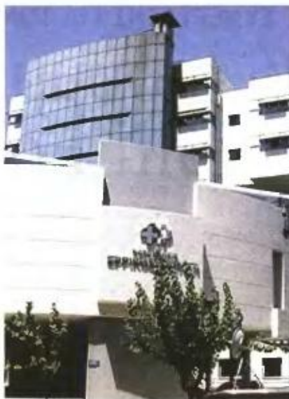
Το νοσοκομείο «Ντυνάν» εντάσσεται και αυτό στο νέο μοντέλο διοίκησης