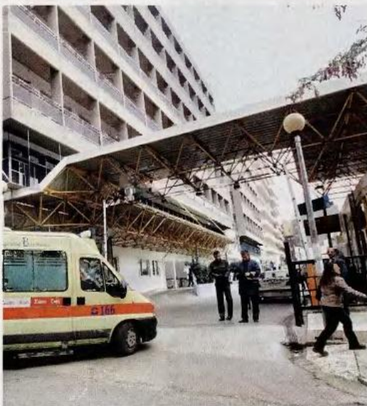
Ο «Ευαγγελισμός» είναι ένα από τα νοσοκομεία στα οποία θα αρχίσει τον Σεπτέμβριο η χορήγηση μεθαδόνης.

Ο κ. Μπόλαρης ανακοίνωσε ότι οι αρμόδιες υπηρεσίες του υπουργείου θα ζητήσουν την επιστροφή των χρηματικών ποσών που έχουν παράτυπα καταβληθεί για προνοιακά επιδόματα