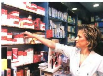
«ΚΡΙΤΗΡΙΟ ένταξης στη συνταγογραφούμενη «λίστα» δεν είναι η τιμή του φαρμάκου αλλά το ημερήσιο κόστος θεραπείας

Κριτήριο ένταξης στη «λίστα» δεν είναι η τιμή του φαρμάκου, αλλά το ημερήσιο κόστος θεραπείας. Το κριτήριο αυτό είναι ό,τι πιο άρπιο μπορεί να εφαρμοστεί, καθώς λαμβάνει υπό-