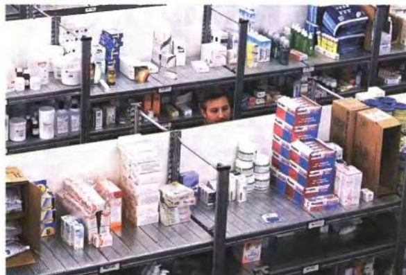
Η θεραπεία των ασθενών φεύγει από τα χέρια των γιατρών, εξηγεί ο πρόεδρος του ΙΣΑ

Η ρύθμιση που κατατέθηκε σε νομοσχέδιο του υπουργείου Εργασίας για συνταγογράφηση μόνο της δραστικής ουσίας του φαρμάκου και όχι εμπορική ονομασία υπηρετεί έναν και μόνον στόχο, τη μείωση της φαρμακευτικής δαπάνης, σε βάρος της ποιότητας των υπηρεσιών υγείας που παρέχονται προς τους πολίτες - ασφαλισμένους, καταγγέλλει το Δ.Σ. του Ιατρικού Συλλόγου Αθηνών.