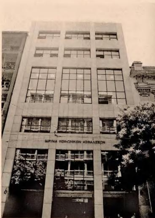
Για την υπαγωγή στον προσωρινό διακανονισμό, αρκεί η υποβολή σχετικής αίτησης στα Ταμεία Είσπραξης Εσόδων ΙΚΑ και στα υποκαταστήματα και παραρτήματα.

Με την τροπολογία παρέχεται η δυνατότητα σε όσους εργοδότες οφείλουν καθυστερούμενες ασφαλιστικές εισφορές στο ΙΚΑ-ΕΤΑΜ και δεν έχουν υπαχθεί σε ρύθμιση ή έχασαν το δικαίωμα σύνδεσης της ρύθμισης στην οποία είχαν κατά το παρελθόν υπαχθεί να υπαχθούν στο καθεστώς του προσωρινού διακανονισμού, και αφορά τόσο ο-