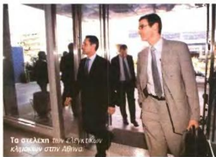
Τα στελέχη των ελεγκτικών κλιμακίων στην Αθήνα.

▼ Διαρθρωτικές αλλαγές και αποκρατικοποιήσεις θα είναι ψηφίδα από ποτέ στην ατζέντα της αξιολόγησης του μεσοπρόθεσμου δημοσιονομικού σχεδίου από την ηγεσία των ελεγκτών από την Ε.Ε., το ΔΝΤ και την ΕΚΤ που έρχεται στην Αθήνα στο τέλος της εβδομάδας. Σύμφωνα με τις πρώτες πληροφορίες, ο αρχικός προγραμματισμός θέλει την αξιολόγηση να μην ξεπερνά σε διάρκεια τη μία εβδομάδα και τους εκπροσώπους των τριών διεθνών οργανισμών να επισκέπτονται σχεδόν όλα τα ελληνικά υπο-