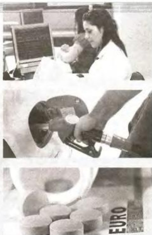
▲ ΕΠΕΙΤΑ ΑΠΟ ΔΙΑΛΟΓΟ οι αλλαγές στο Φορολογικό. Πάτση λαθρεμπορίου καυσίμων και ηλεκτρονική συνταγογράφηση ανάμεσα στους στόχους του Αυγούστου