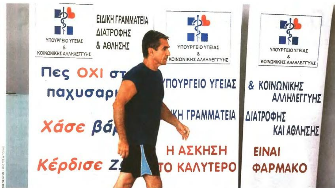
Ο Ανδρέας Λοβέρδος αναλαμβάνει δράση για την προώθηση της δωρεάς οργάνων στη χώρα μας, αρχίζοντας από τα ίδια τα μέλη της κυβέρνησης. Εδώ, ο υπουργός σε πρόσφατο αγώνα μάσκει που διοργάνωσε το υπουργείο Υγείας με στόχο την ευαισθητοποίηση σχετικά με την παχυσαρξία