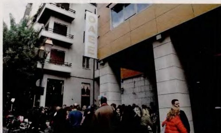
Για τον μήνα Ιανουάριο, το ΙΚΑ και ο ΟΑΕΕ δεν κατέβαλαν στον Οργανισμό ούτε ένα ευρώ από τις εισφορές ασφαλισμένων. Από τα 320 εκατ. ευρώ που έπρεπε να λάβει ο ΕΟΠΥΥ πήρε μόνο 100 εκατ. από άλλα ταμεία.