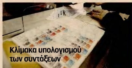
Κλίμακα υπολογισμού των συντάξεων

Μάλιστα, οι εκκρεμότητες που υπάρχουν συνδυάζονται με τα ελλείμματα και αφορούν τη χορήγηση του εφάπαξ βοηθήματος, την εφαρμογή του συντελεστή