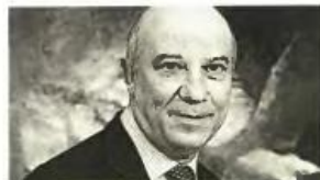
Κωνσταντίνος Ευρινίδης, CEO Genesis Pharma

Υπέρ μιας αμοιβαίας επωφελούς λύσης στο ζήτημα του χρέους και κατά της ρήξης με τους πιστωτές μας τάσσεται σύσσωμος ο επιχειρηματικός κόσμος, ο οποίος υπογραμμίζει την ανάγκη να παραμείνει η χώρα εντός του ευρωπαϊκού πλαισίου και εντός της Ευρωζώνης. Σύμφωνα με κορυφαία στελέχη επιχειρήσεων που μίλησαν στην «Η», προτεραιότητα της νέας κυβέρνησης πρέπει να είναι η διασφάλιση της χρηματοδότησης της ελληνικής οικονομίας σε συμφωνία με τους εταίρους μας, προκειμένου να μπει τέλος στην αβεβαιότητα και να ανοίξει τον δρόμο για την επιστροφή στην ανάπτυξη, καθώς, όπως λένε, «ούτε η οικονομία, αλλά ούτε και η κοινωνία μπορούν να αντέξουν μια μακρά περίοδο αβεβαιότητας, πτώσης και ρήξης». Στο πλαίσιο αυτό καλούν τη νέα κυβέρνηση να καταθέσει γρήγορα το σχέδιο εξόδου από την κρίση και να εξειδικεύσει τις προτάσεις της για την επόμενη ημέρα της ελληνικής οικονομίας, ενώ δεν κρύβουν την ανησυχία τους για το αρνητικό κλίμα που έχει δημιουργηθεί στο εξωτερικό, μετά τις δηλώσεις των νέων υπουργών για το «πάγωμα» των αποκρατικοποιήσεων.