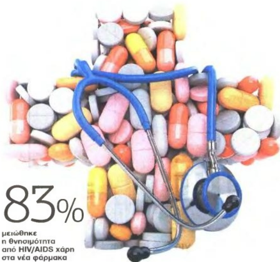
83% μειώθηκε η θνησιμότητα από HIV/AIDS χάρη στα νέα φάρμακα