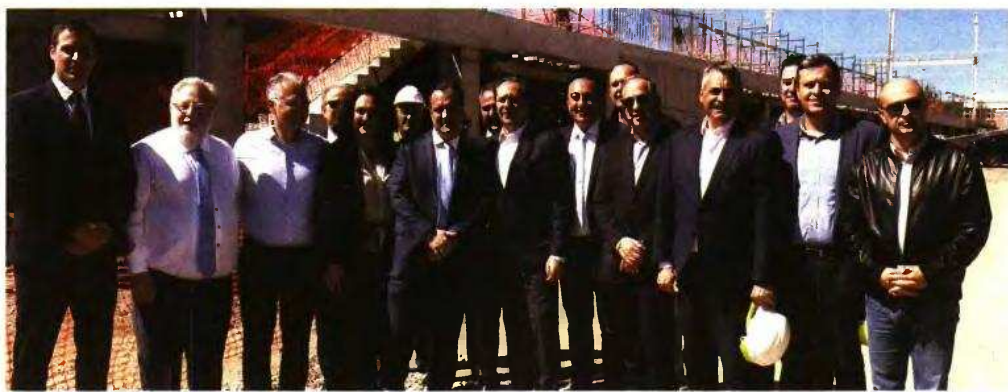
Το εργοτάξιο τριών ελληνικών φαρμακοβιομηχανιών στη ΒΙΠΕ Τρίπολης επισκέφθηκε την Κυριακή ο υπουργός Υγείας

Σε άλλο σημείο, ο υπουργός επανέλαβε ακόμη μία φορά ότι είναι διατεθειμένος να προχωρήσει σε αισθητές αυξήσεις στις λιανικές τιμές εκείνων των γενόσημων φαρμακευτικών σκευασμάτων τα οποία έχουν σήμερα λιανική τιμή από λιγότερο από 1 ευρώ έως 15 ευρώ ανά κουτί, καθώς -όπως υπογράμμισε με ιδιαίτερη έμφαση-, «όλη αυτή η πολιτική, την οποία εφαρμόζουμε την τελευταία δεκαετία για την τιμολόγηση των γενόσημων, είναι λανθασμένη».