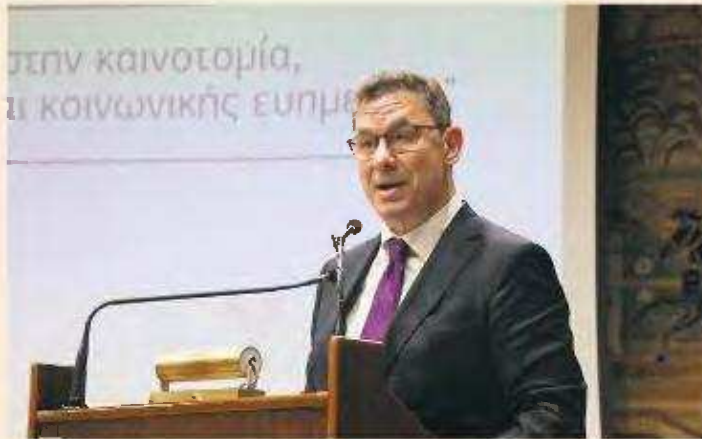
Η στρογγυλή τράπεζα των διευθυνόντων συμβούλων βιοφαρμακευτικών πραγματοποιείται στην Ελλάδα κατόπιν πρωτοβουλίας του Αλμπερτ Μπουρλά της Pfizer, ο οποίος έχει την προεδρία αυτής της διοργάνωσης.

Επαφές με τους διευθύνοντες συμβούλους θα έχει σήμερα και αύριο ο πρωθυπουργός.