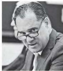
Ο υπουργός Υγείας, Αδωνίς Γεωργιάδης, χαρακτήρισε τον ΕΗΦ ως «επανάσταση για την Υγεία».

υπηρεσιών υγείας και τη μείωση της ταλαιπωρίας των πολιτών. Ο ΕΗΦ είναι ένα ολοκληρωμένο ηλεκτρονικό σύστημα, που συγκεντρώνει όλα τα ιατρικά δεδομένα ενός ασθενούς σε μια ενιαία ψηφιακή πλατφόρμα. Περιλαμβάνει το ιατρικό ιστορικό, τις διαγνωστικές εξετάσεις, τις συνταγογραφήσεις, τα παραπεμπτικά, τις απεικονιστικές εξετάσεις, τις ιατρικές βεβαιώσεις, τους εμβολιασμούς και τον προγραμματισμό ραντεβού. Η πρόσβαση σε αυτά τα δεδομένα γίνεται ήδη μέσω της εφαρμογής MyHealth App για τους πολίτες