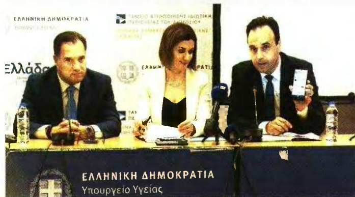
Αδωνις Γεωργιάδης, Ειρήνη Αγαπηδάκη και Δημήτρης Παπαστεργίου στη χθεσινή παρουσίαση του Εθνικού Ηλεκτρονικού Φακέλου Υγείας

Για «νέα σελίδα», «νέο οικοσύστημα» και «ψηφιακή επανάσταση» έκαναν λόγο χτες οι υπουργοί που παρουσίασαν ξανά τη δημιουργία ηλεκτρονικού φακέλου υγείας