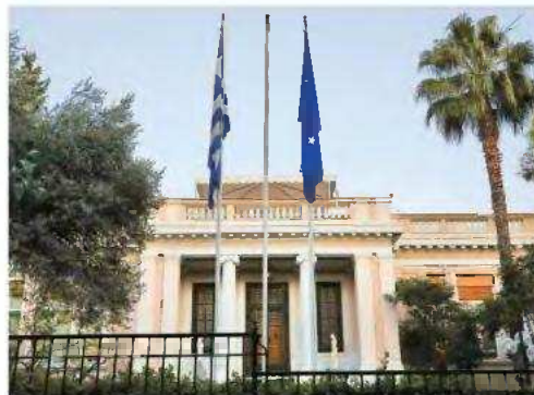
Οι αλλαγές θα φτάσουν μέχρι τον πυρήνα του Μεγάρου Μαξίμου, κάτι που θα επηρεάσει και τις μετακινήσεις σε άλλα υπουργεία.

Όσον αφορά το υπουργείο Εθνικής Οικονομίας και Οικονομικών -σε περίπτωση που ο Χ. Χατζηδά-