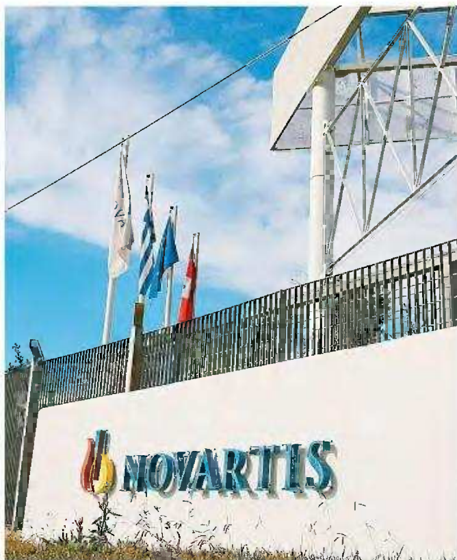
ΕΜ / ALEXANDROS VLACHOS

Η υπόθεση, που από τον τότε αναπληρωτή υπουργό Δικαιοσύνης Δημήτρη Παπαγγελόπουλο χαρακτηρίστηκε «το μεγαλύτερο σκάνδαλο από συστάσεως ελληνικού κράτους», βρήκε τον δρόμο προς το ακροατήριο του Μονομελούς Πλημμελειοδικείου της Αθήνας οκτώ χρόνια μετά τις καταθέσεις των προστατευόμενων μαρτύρων που έβαζαν στο κάδρο των δωροδοκιών δέκα πολιτικά πρόσωπα. Ήταν 5 Φεβρουαρίου 2018 όταν οι καταθέσεις των μαρτύρων με τις κωδικές ονομασίες «Μάξιμος Σαράφης» και «Αικατερίνη Κελέση» στοχοποιούσαν δέκα πολιτικούς, κάνοντας λόγο για δωροληψίες προκειμένου να ευνοηθεί ο φαρμακευτικός κολοσσός. Τελικά, η δικογραφία αρχειοθετήθηκε στο σκέλος που αφορά τους Αντώνη Σαμαρά, Παναγιώτη Πικραμμένο, Γιάννη Στουρνάρα, Ευάγγελο Βενιζέλο, Ανδρέα Λυκουρέντζο, Μάριο Σαλιά, Γιώργο Κουτρου-