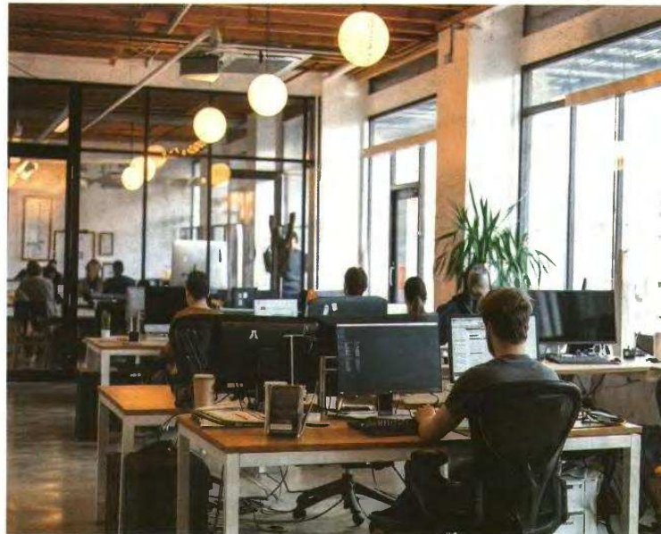
Την αντίθεσή του στη μονομερή προσφυγή στον ΟΜΕΔ διατύπωσε ο ΣΕΒ στις προκαταρκτικές συζητήσεις για την επαναφορά των συλλογικών διαπραγματεύσεων.

Ο νόμος δίνει το δικαίωμα προσφυγής στον ΟΜΕΔ και από τα δύο μέρη (από κοινό ο εργοδότης και ο εργαζόμενος) αλλά και μονομερώς, που επιλέγεται από τους εργαζομένους. Αυτό που φάνηκε στις συζητήσεις των τεχνικών κλά-