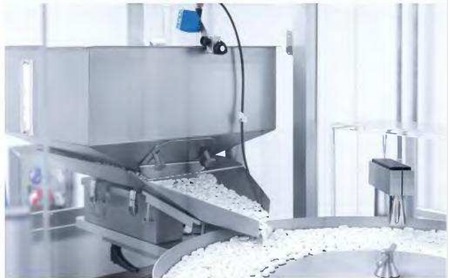
ΕΤΑΙΡΙΚΗ ΕΠΙΚΟΙΝΩΝΙΑ Λ

οικονομική ύφεση αλλά και η πανδημία του COVID-19 αποτέλεσαν δομικές προκλήσεις για τις οποίες απαιτήθηκαν κρίσιμες αποφάσεις και νηφάλιοι χειρισμοί... Ξέρετε όμως η φιλοσοφία μου και η στάση ζωής μου είναι πάντα αισιόδοξη, δεν γκρινιάζω και δεν μεμφιμοιρώ, συνεχίζω κάθε μέρα σαν να είναι η αρχή του παντός και αυτό μου δίνει πολλή δύναμη.